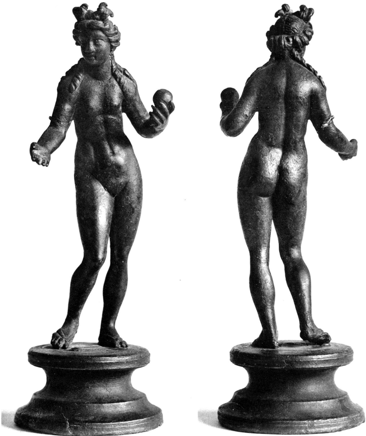
STATUETTE DE VÉNUS TROUVÉE À POLIEZ-PITTET (VAUD)