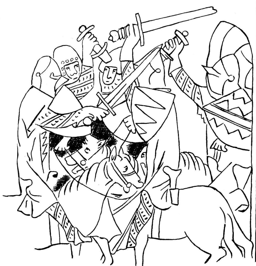
Abb. 2. Miniatur aus dem Codex Balduini: Der Aufstand der Mailänder, 1311.

Daß auch im Süden dem Schweizerdolch ähnliche Waffen getragen wurden, beweist eine selten schön illuminierte Handschrift in der Universitätsbibliothek zu Genf, das Decretum des frater Adigherius von Bologna (Ms. lat. 60). Die Miniaturen, die den Eindruck von Gemälden machen, sind in leuchtenden Deck-