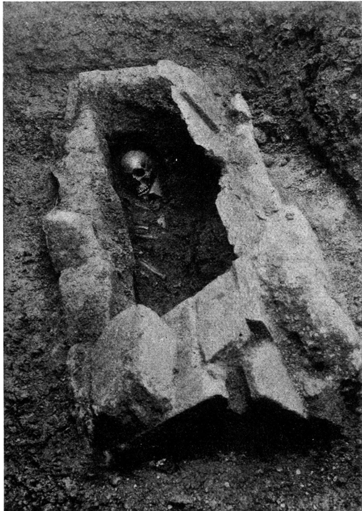
Abb. 8. Oberburger Plattengrab 1918.

groß sind, und von den Dachziegeln, die spätrömische Form zeigen. Unter den abgefallenen Grabteilen lag das Falzziegelbruchstück mit den Buchstaben I R, von dem noch besonders zu sprechen ist. Das Grab ist, getreu wieder aufgebaut, im Museum aufgestellt; mit dem Skelett, dessen Bestandteile der Konservator sorgfältig zusammengefügt hat. In einem Kistchen neben dem Grabe liegen die Steine und die Erde aus der Schädelhöhle. Bemerkenswert ist, daß einige der Zähne Schäden aufweisen, die höchst wahrscheinlich, auch nach Ansicht Sachverständiger, von der Zahnkrankheit Karies der lebenden Person herrühren.