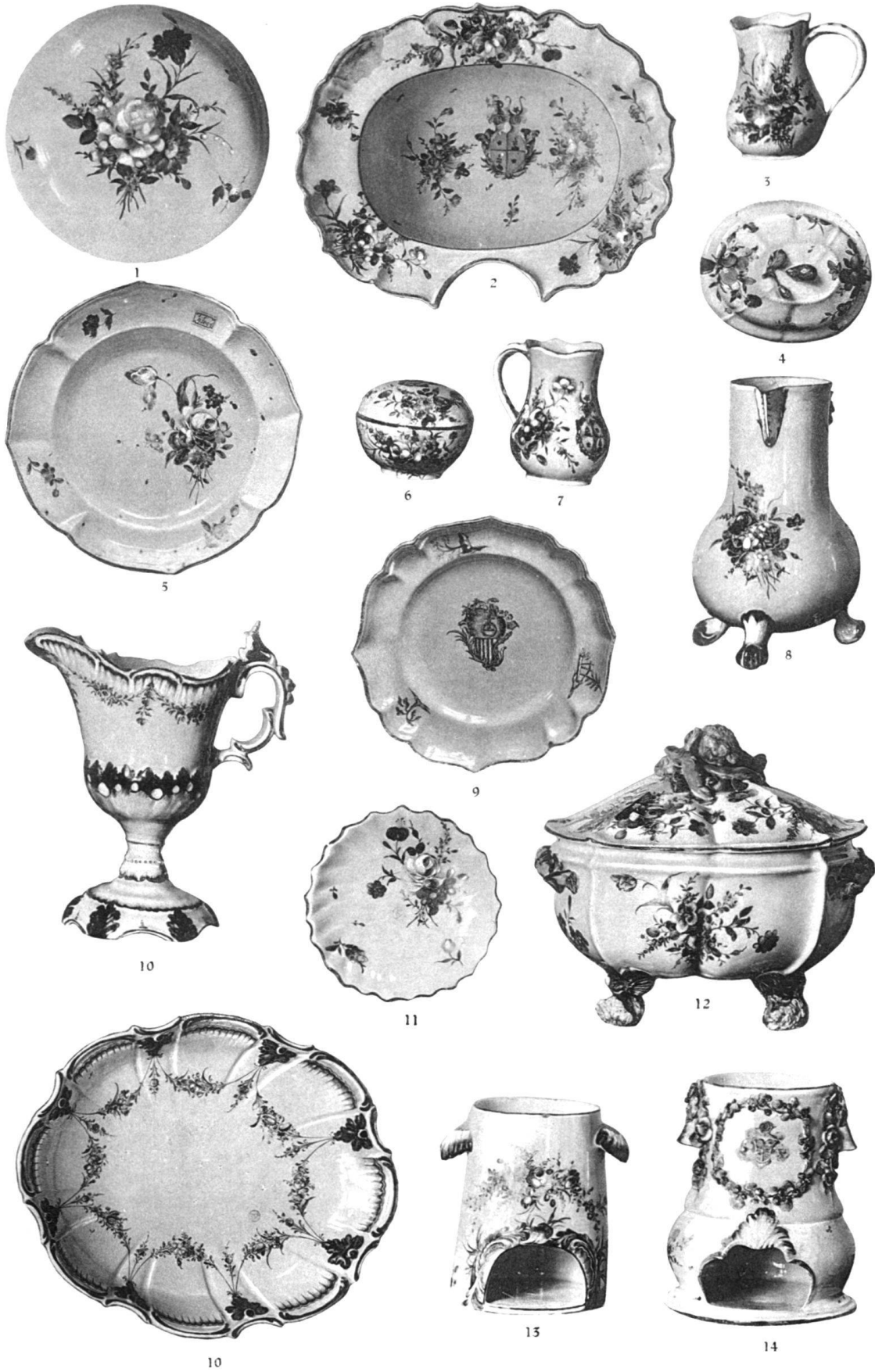
Beromünster-Luzern. Sayencen des Andreas Dolder. Schweiz. Landesmuseum.