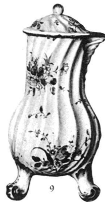
Beromünster-Luzern. Sayencen des Andreas Dolder. Schweiz. Landesmuseum.