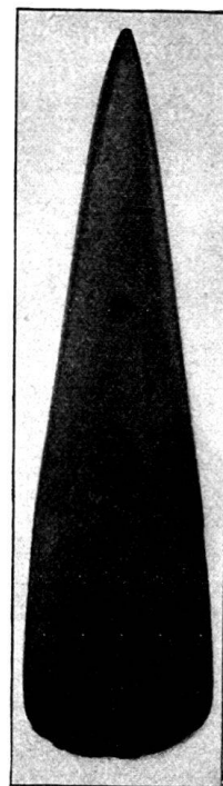
Abb. 15. Zierbeil aus Serpentin mit Schnurloch, von Cham. Ca. 1:4. Sammlung der Kantonsschule.