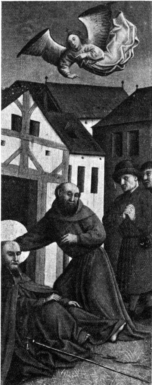
Abb. 2. Der Tod des hl. Antonius.

nunmehr von der Münchener Pinakothek erworben wurden, wo sie die reiche, aber gerade an oberrheinischen Werken spärliche Sammlung spätgotischer Bilder glücklich ergänzen. Die in den alten Teilen gut erhaltenen Bilder weisen an den Schmal-