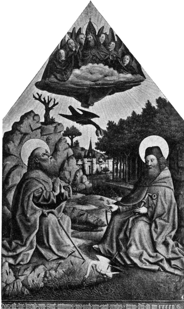
Abb. 1. Die Legende der Heiligen Antonius und Paulus (Donaueschingen, Galerie).

Vor der urtümlichen Wucht und leuchtenden Farbenpracht der Tafeln des Konrad Witz verblasen die Werke der gleichzeitigen oberrheinischen und