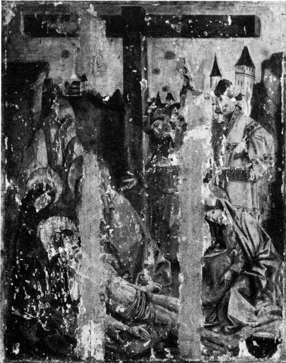
Abb. 4. Beweinung Christi; Rückseite des Drachenkampfes. (Basel, Öffentliche Kunstsammlung.)

Christi) besagen wenig, angesichts der herben Größe der in stummer Trauer sich neigenden Gestalten. Die Landschaft ist nur cursorisch und obenhin behandelt. Die etwas trockene Farbe hat zum Teil durch eingreifende Übermalung gelitten. Vergleicht man die rechte Hand des Mannes unter dem Kreuz