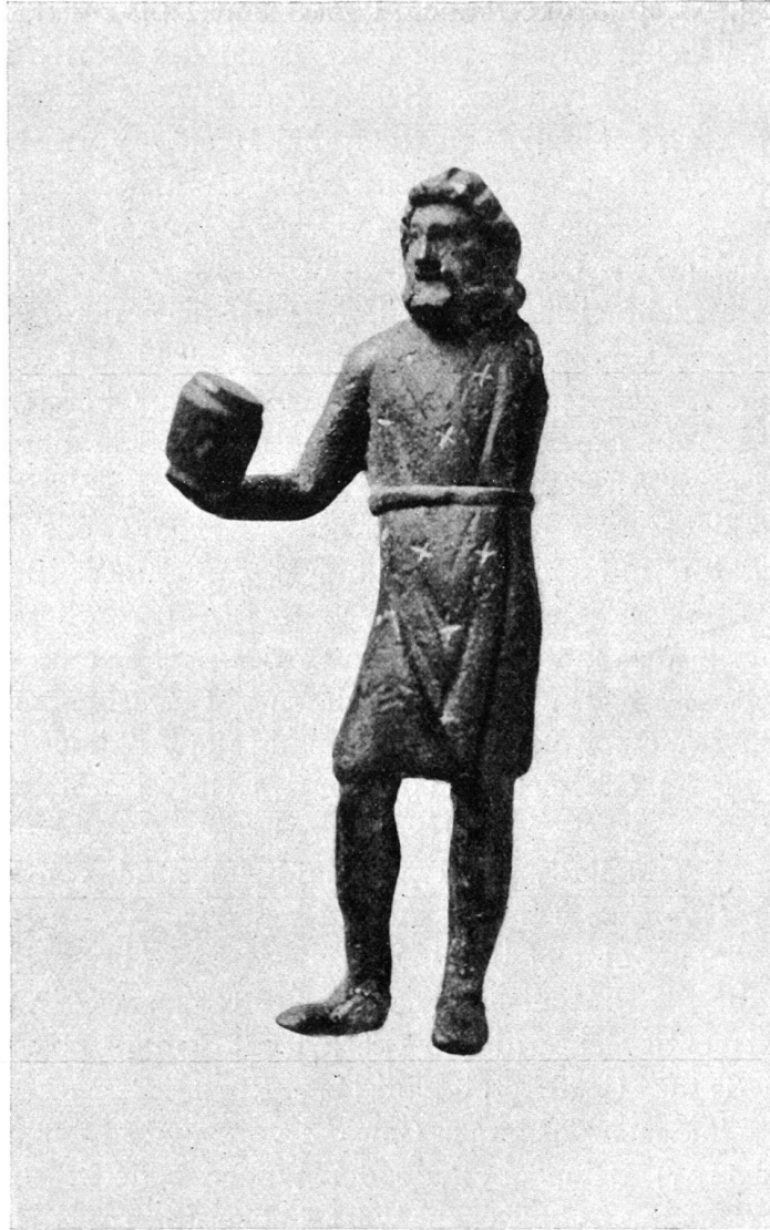
Abb. 3. Sucellus aus Pully. (Zu S. 23.)

Der im Anz. 1921, 25 erwähnte gallorömische Tempel auf der Engehalbinsel bei Bern ist jetzt sorgfältig behandelt und im Grundriß abgebildet von E. Schneeberger im Jahresbericht des historischen Museums in Bern 1919, S. 14 ff.; vgl. O. Schultheß, 12. Jahresber. der Schweiz. Ges. f. Urgesch. (1919/20), S. 105