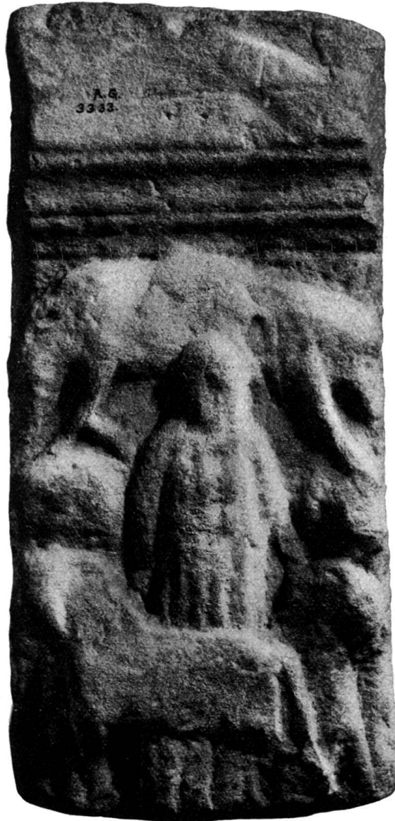
Abb. 2. Epona aus Seegräben. (Zu S. 20.)

Dem gallischen Gott mit dem Schlegel, den man auf helvetischem Gebiet Sucellus zu nennen berechtigt ist, sind neuerdings sorgfältige Besprechungen