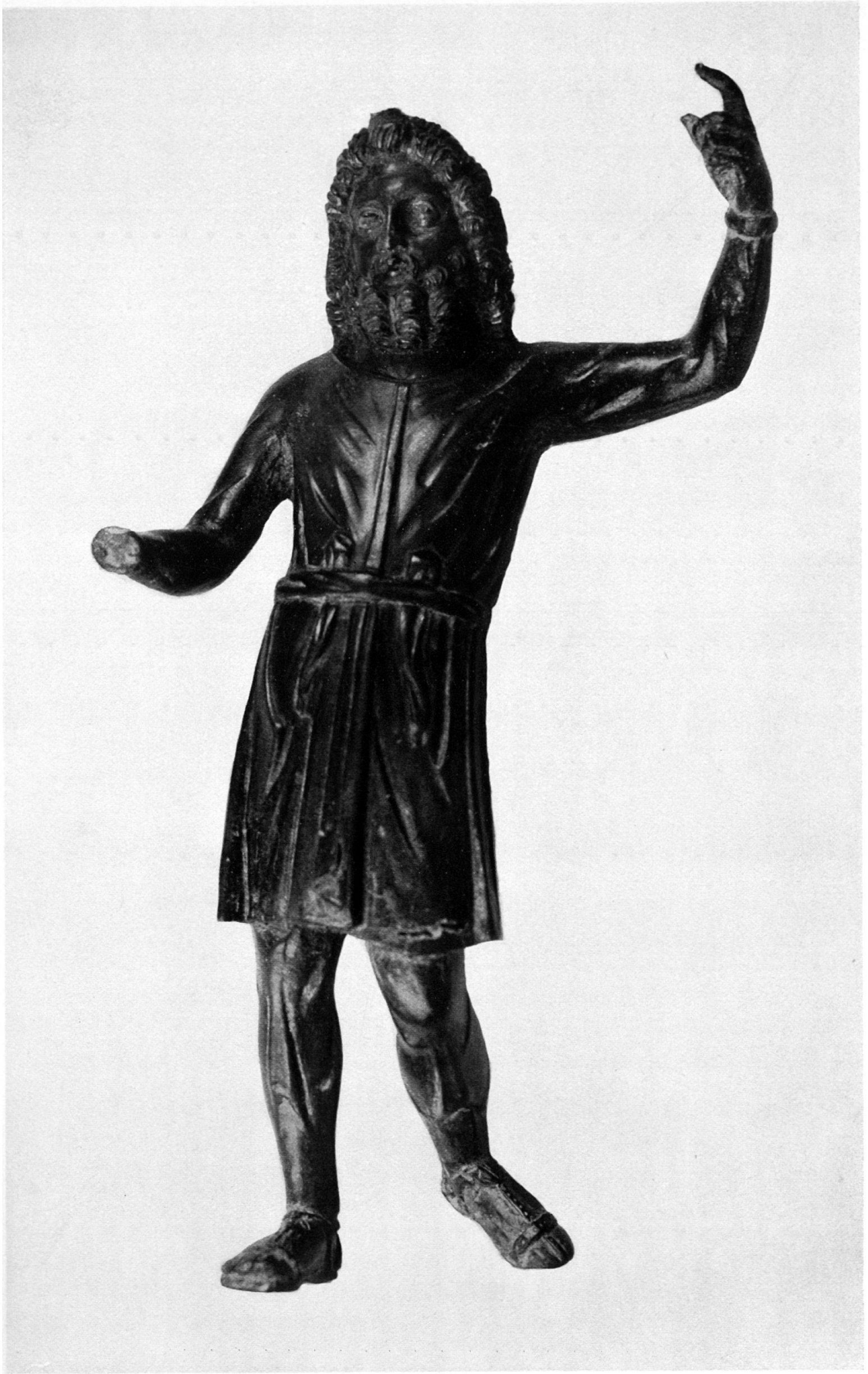
SUCELLUS AUS LAUSANNE. (Zu S. 23.)