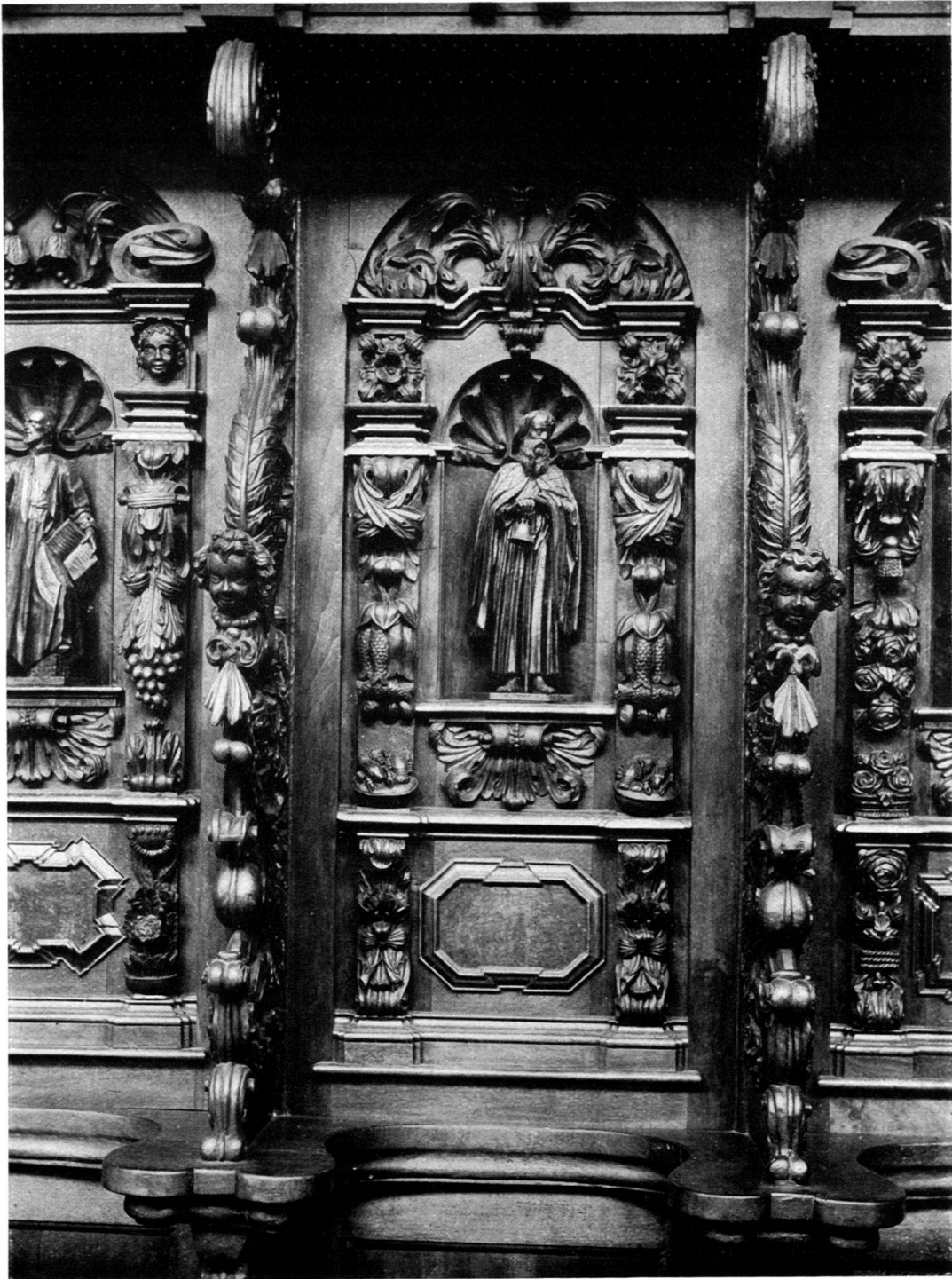
Chorgestühl der Kartause Ittingen: SCHNITZEREIEN der Rückwand (Teilstück).