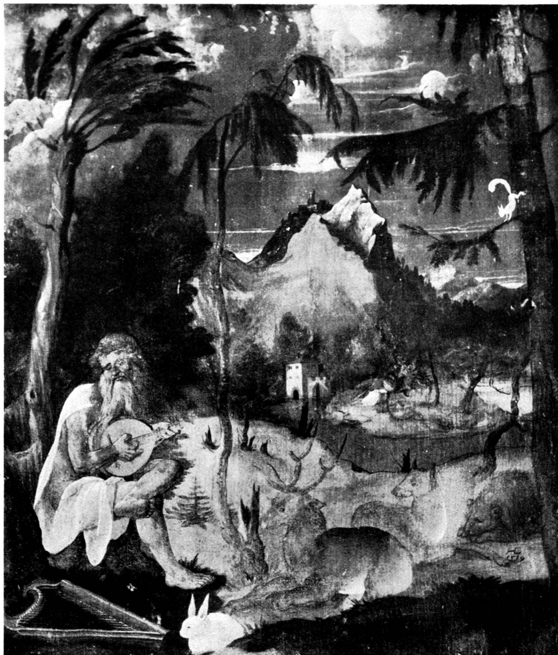
ORPHEUS MIT DEN TIEREN. Basel.