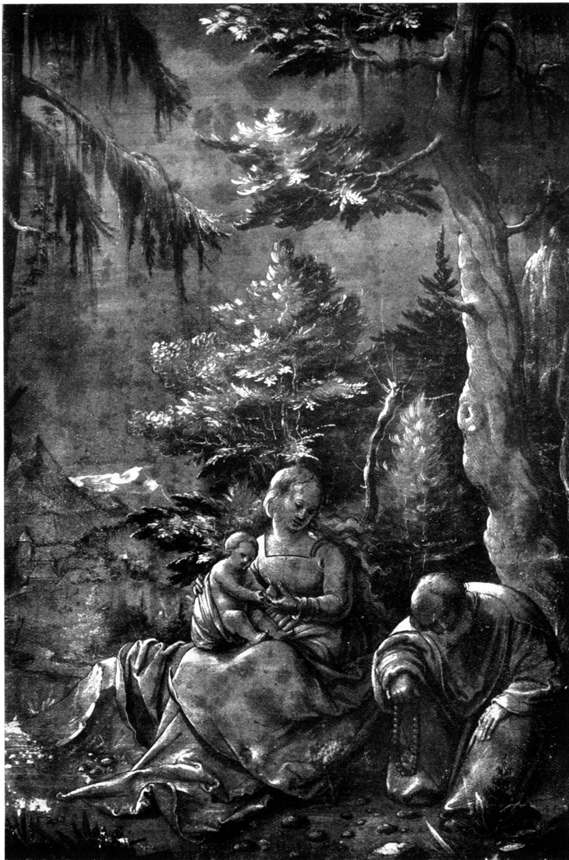
HL. FAMILIE. Berlin (Privatbesitz).