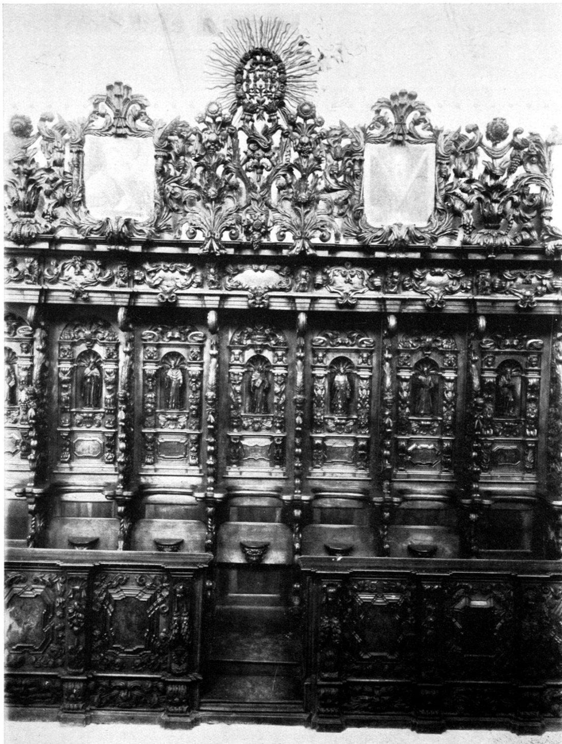
Chorgestühl der Kartause Ittingen: SITZREIHE an einer Seitenwand.