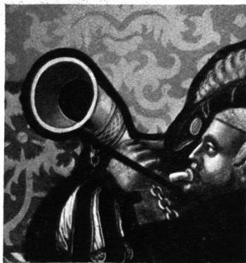
8. 1557 u. 1624.