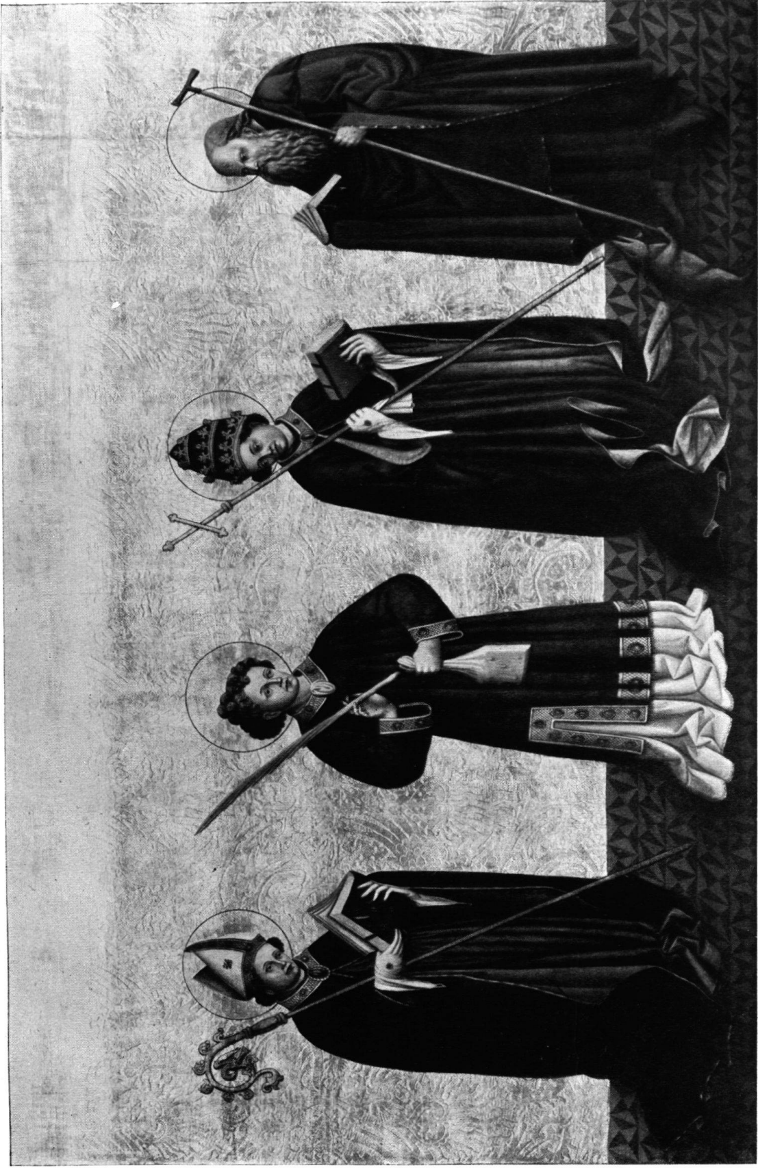
Albrecht Mentz: VIER HEILIGE AUF GOLDGRUND. (Museum Solothurn.)