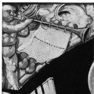
17a. 16. Jh. Anf.