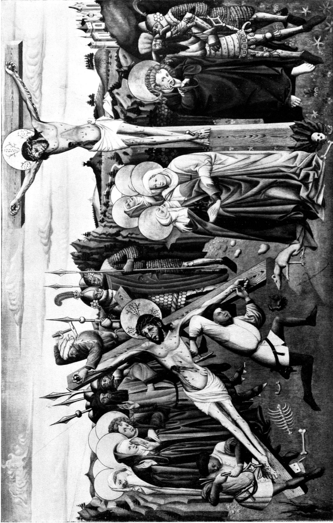
Albrecht Mentz: KREUZIGUNG. (Museum Solothurn.)