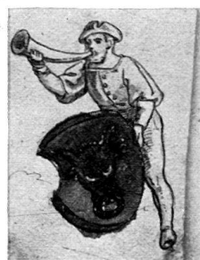
4. 16. Jh. I. Viertel