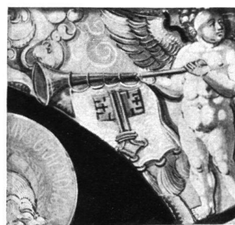
17b. 16. Jh. Anf.