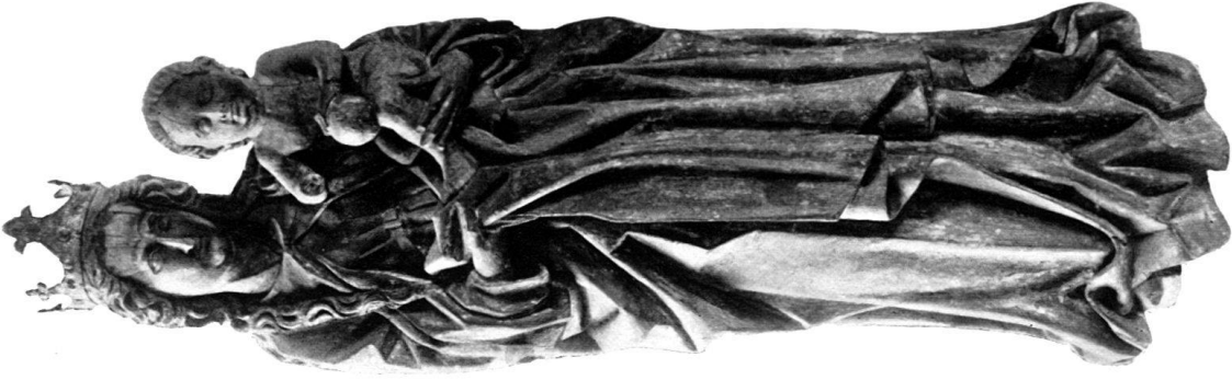
b) MADONNA, Holz, aus Hinter- hünenberg. Landesmuseum.