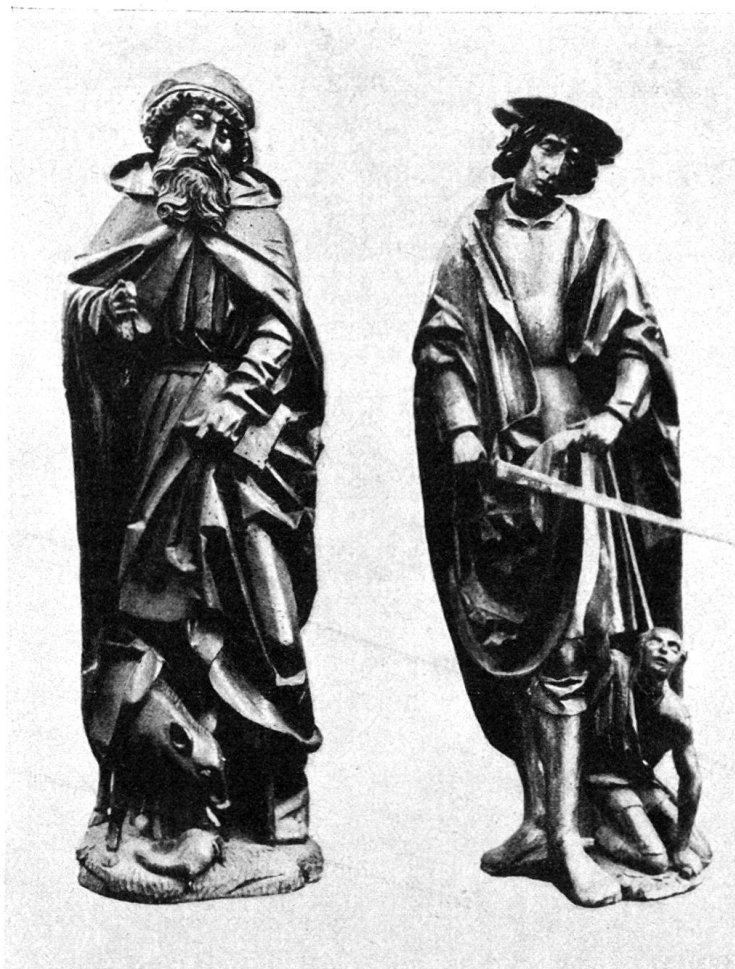
Abb. 1. Die Heiligen Antonius und Martin in Cugy.

Anschauung: er war 1513 beim Zug nach Dijon dabei. Geiler hat einen individuellen Gesichtstypus: die Köpfe sind klein, mit kurzem, dünnem Mund, schmalschlitzigen Augen, scharfem Nasenrücken und spitzem Kinn. Die dünngrätigen Falten fließen geschmeidig. Sie werfen wenig Licht, so daß eine reizvoll flimmernde Gesamtwirkung entsteht. Er liebt es, eigentümlich stilisierte Landschaften anzudeuten. Fast genau dieselbe Komposition der Kreuzabnahme hat Geiler auf einem der vier Reliefs aus Cugy wiederholt.