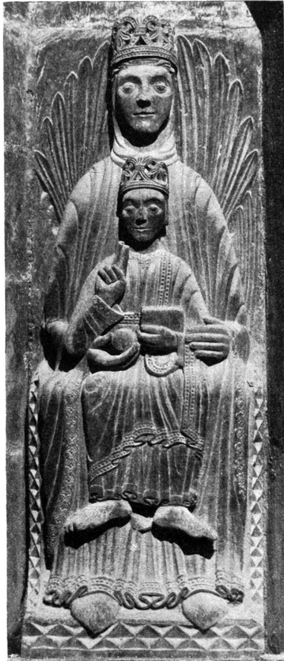
Abb. 3. Maria über dem Südportal der Kirche von Sainte-Ursanne. Sandstein.

geordnet, hielten das Kind, das, wie ein Dübelloch verrät, inmitten des Schoßes saß. Die Linke zieht zugleich den goldenen Mantel in einer Diagonalen über den Unterkörper. Der Stil der Figur weist auf die erste Hälfte des 13. Jahrhunderts.