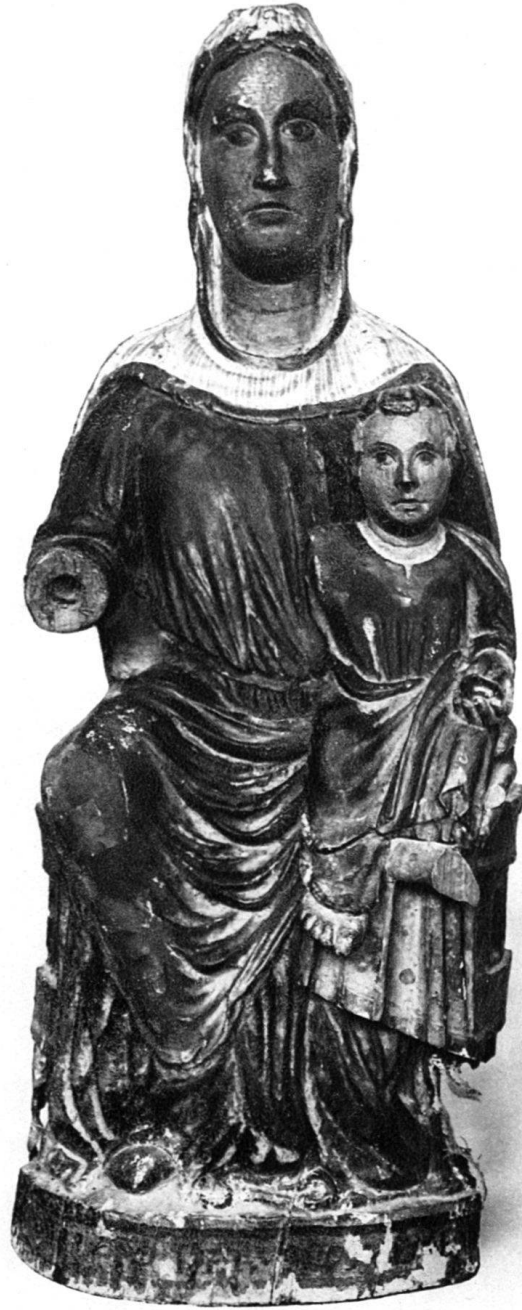
Maria aus Naters Holz