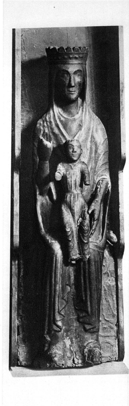
2. Maria aus dem Pustertal Holz München, Bayerisches Nationalmuseum