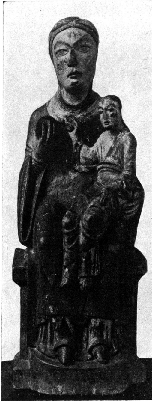
Abb. 4. Maria aus Obercastels. Holz. Disentis, Museum.

reichen Gewänder bilden flache Falten mit parallel zueinander laufenden unruhigen Zickzacksäumen, wie sie einfacher die Figuren der Basler Galluspforte,