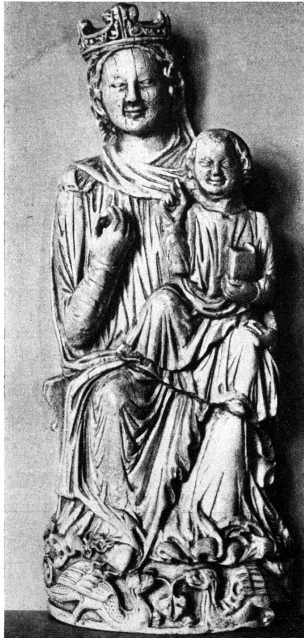
Abb. 5. Maria aus Baden. Elfenbein. Kloster Mehrerau.

Kreis Friedrichs II. und die Reimser Visitatio bezeichnend sind. Zumal die Badener Elfenbeinfigur verrät ihre Abhängigkeit von der Antike ebenso stark