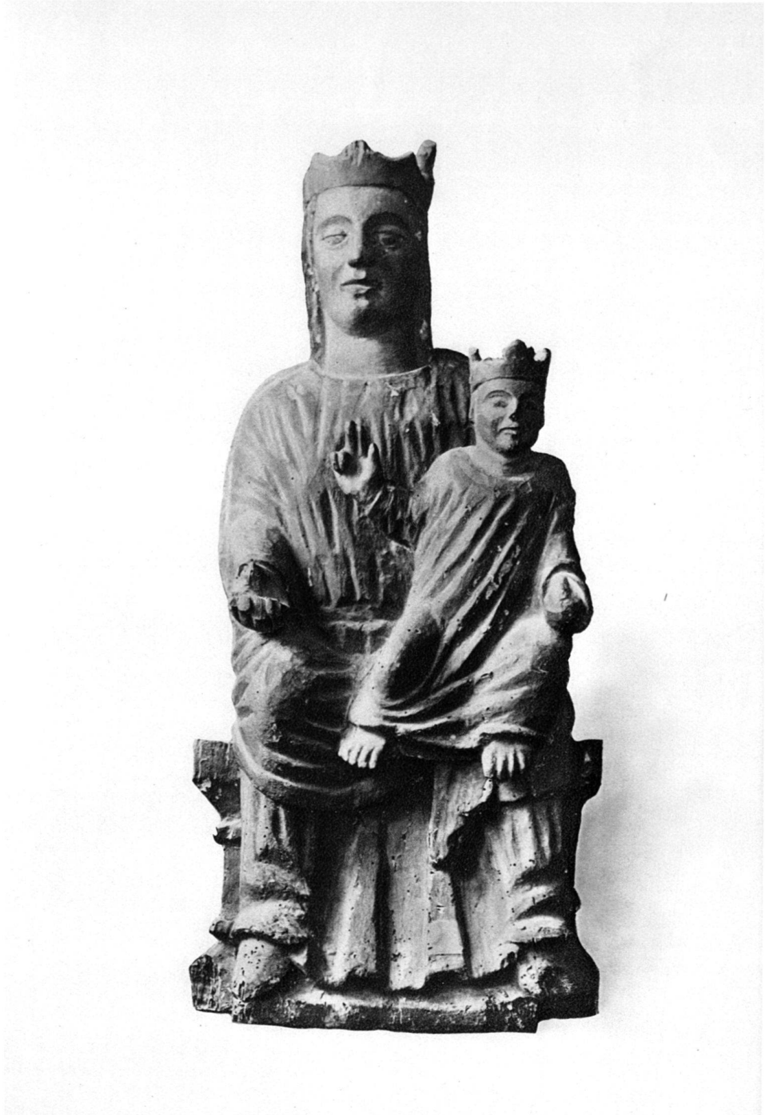
Maria aus Vex Holz Valeria ob Sitten