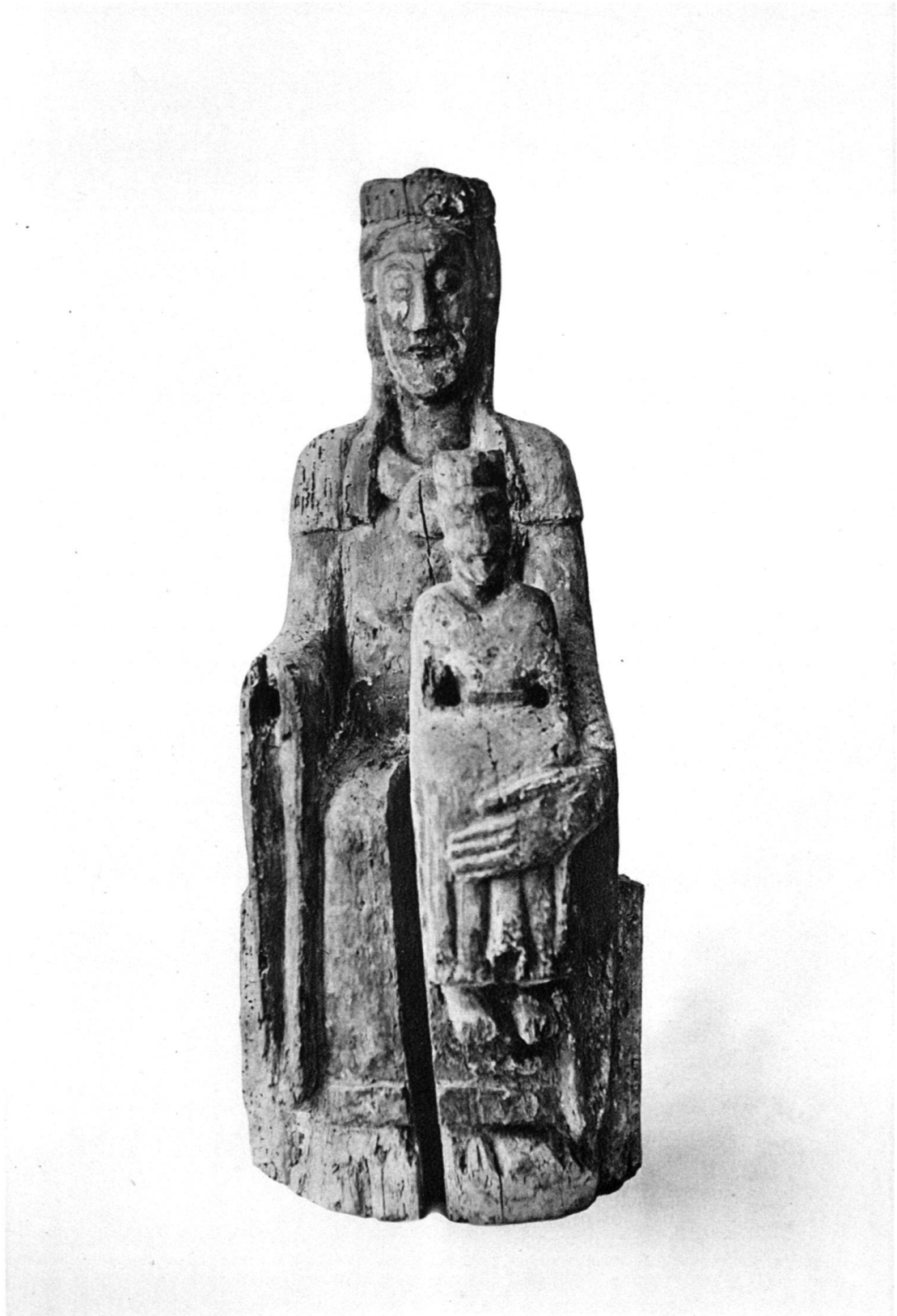
Maria aus Einsiedeln Holz Einsiedeln, Sammlung Birchler