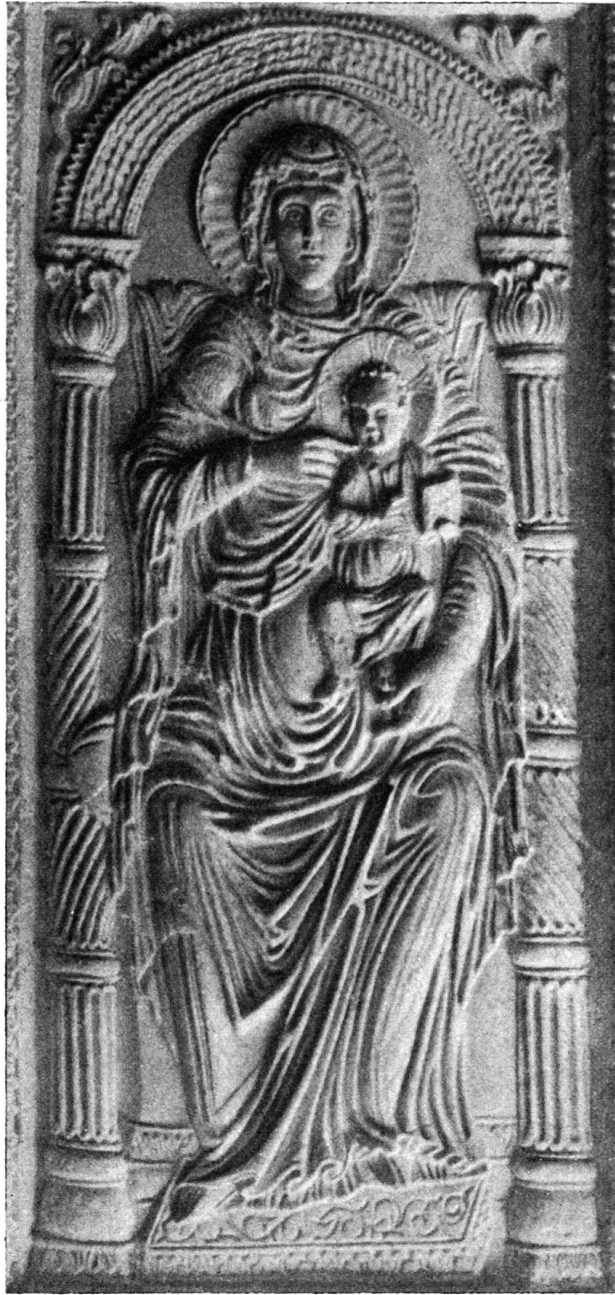
Abb. 1. Maria auf dem Lorsch Buchdeckel. Elfenbein. London, Victoria and Albert Museum.

häufiger finden sich byzantinische Elfenbeinreliefs mit Halbfiguren, so in der Bibliothèque Nationale zu Paris, im Domschatz zu Aachen 1) , in Mailingen 2) .