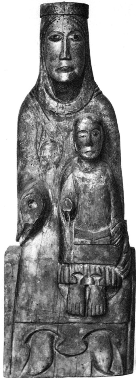
2. Maria aus Raron Holz Zürich, Schweizerisches Landesmuseum