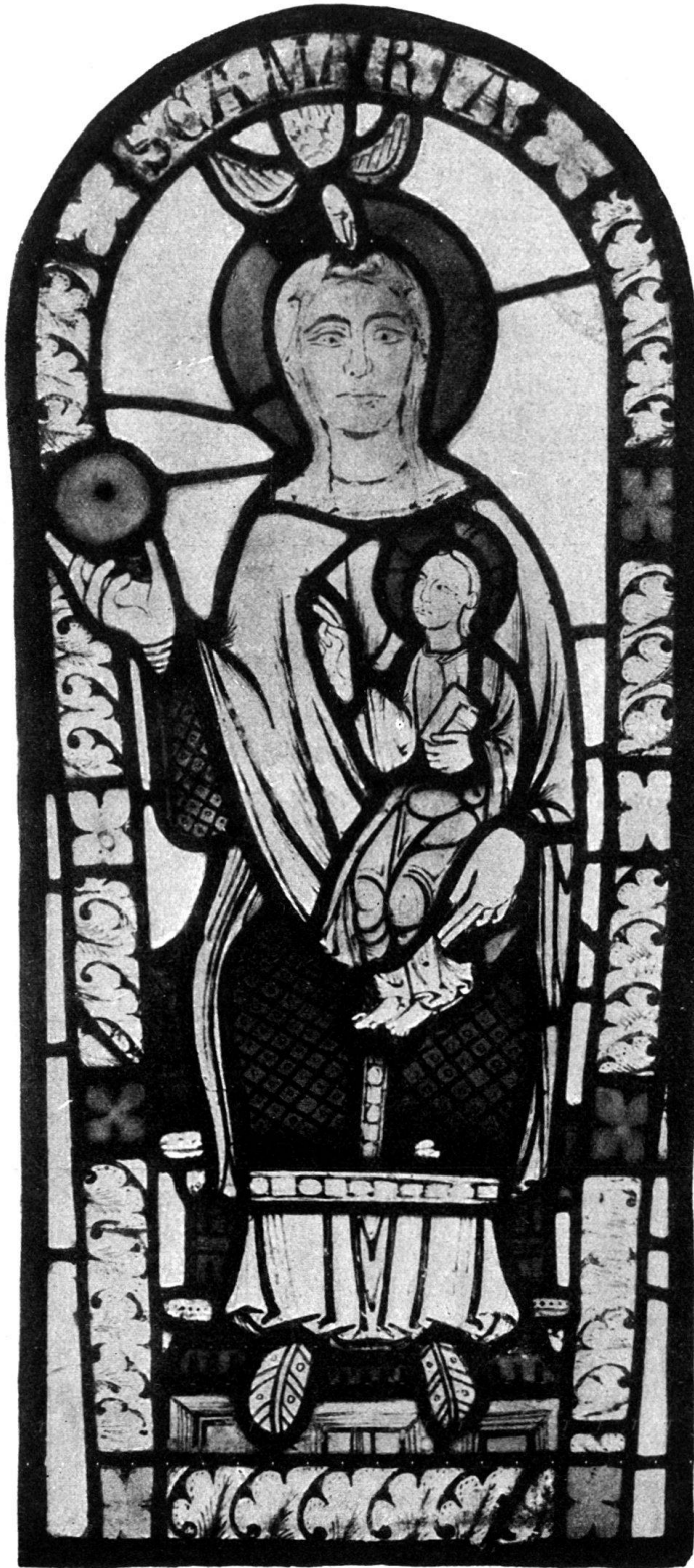
Abb. 2. Maria aus St. Jakob ob Flums. Glasfenster. Zürich, Schweizerisches Landesmuseum.