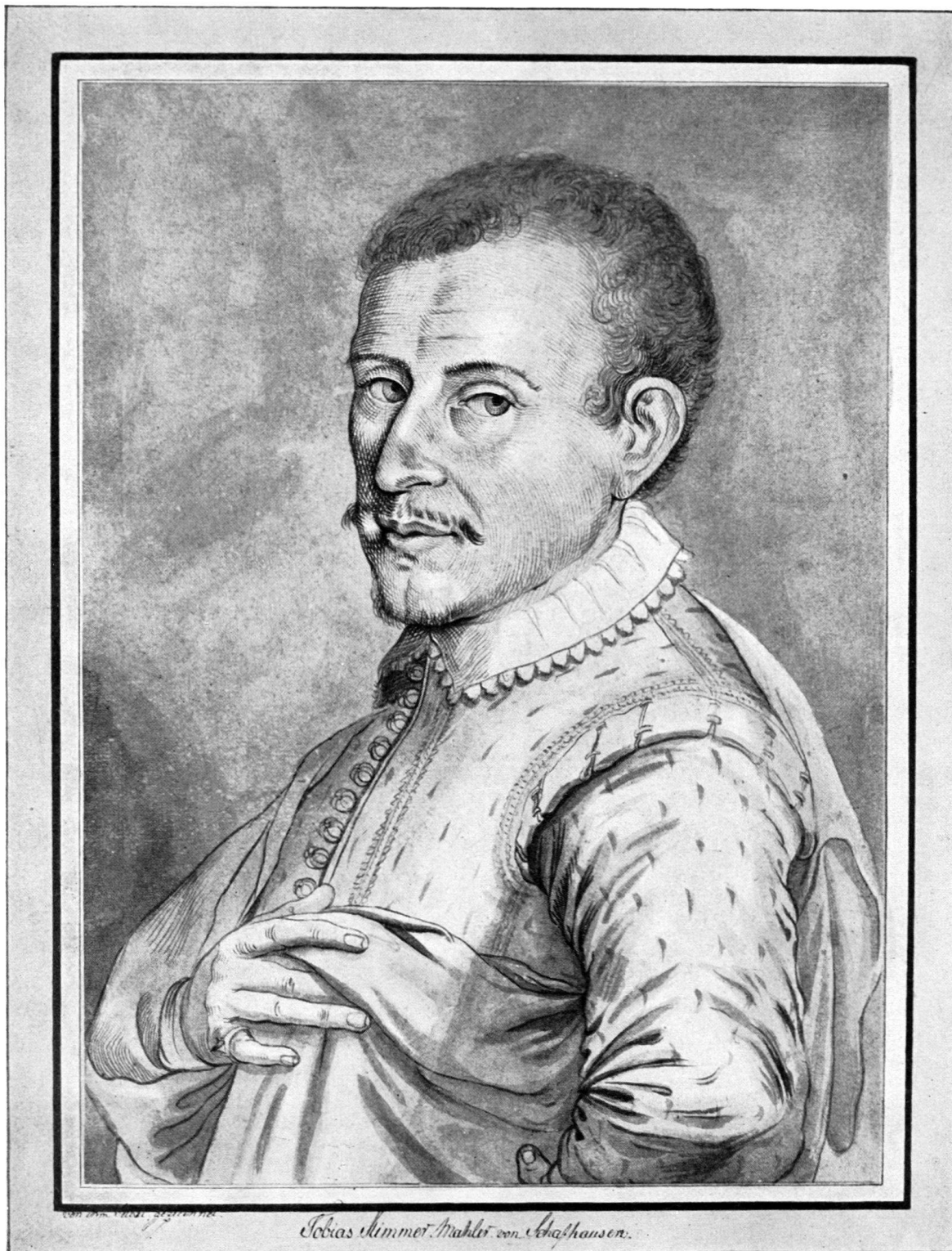
Original im Künstlerbuch in der historischen Sammlung in Zofingen.