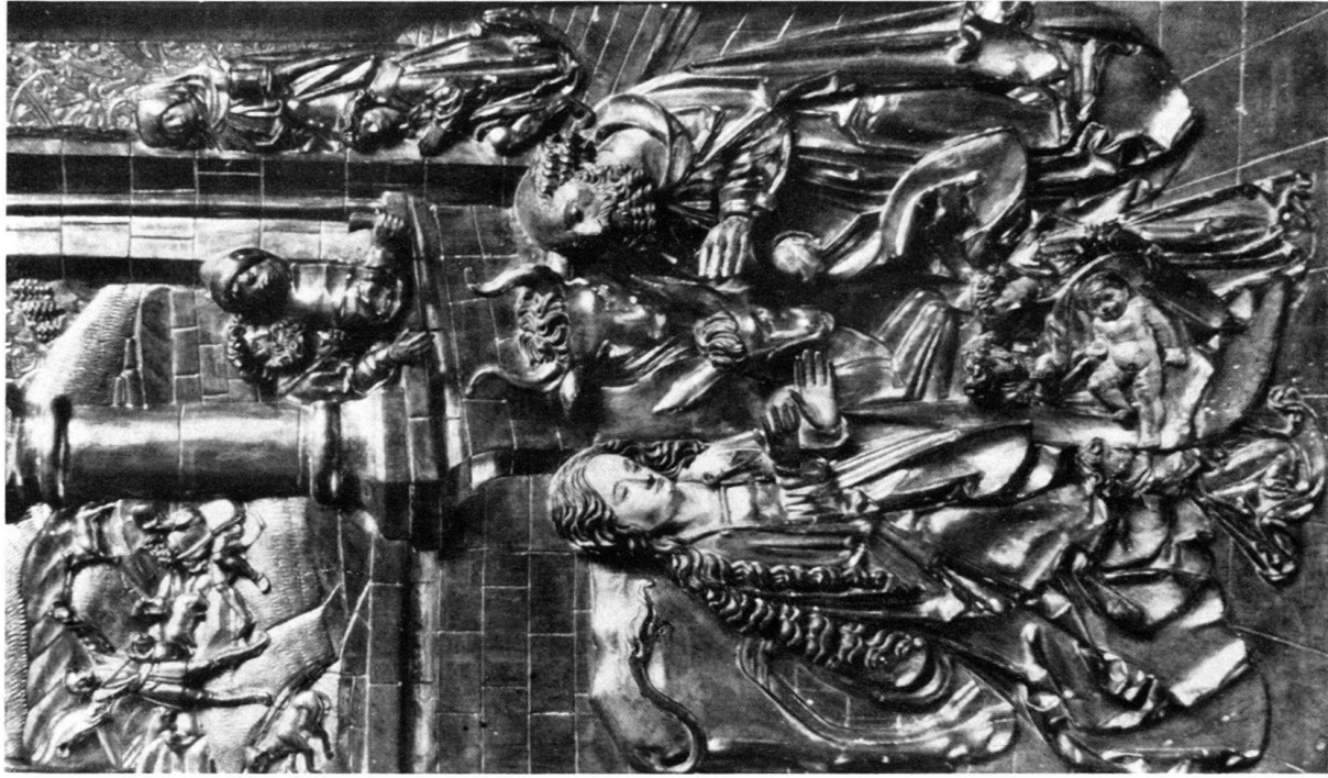
a) Geburt Christi vom Furnoaltar (Taf. XVII, a).