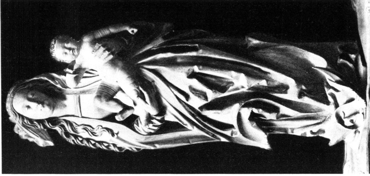
b) Madonna aus Berner Privatbesitz.