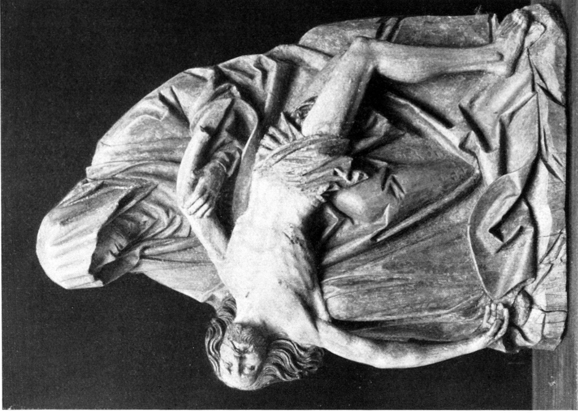
b) Beweinung Christi. Basel, historisches Museum.