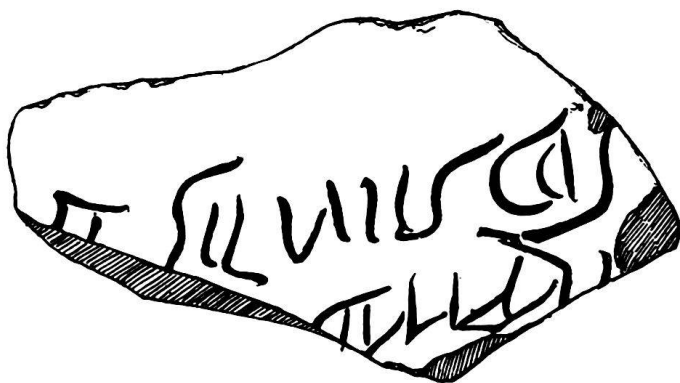
Fig. 4. Graffite. C. 1187.

Un fragment dont la pâte grossière, l'épaisseur, la courbure, indiquent qu'il provient d'un récipient de grandes dimensions, amphore ou dolium, montre le graffite suivant: