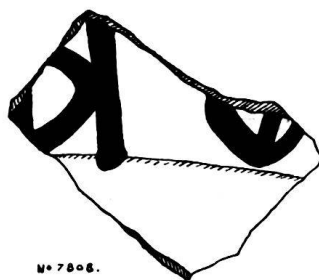
Fig. 5. N° 7808.

Un fragment provenant des Tranchées (Malagnou, n° 7808, don Reber), en terre gris-jaune, épaisse, appartenait assurément aussi à un dolium. Il montre