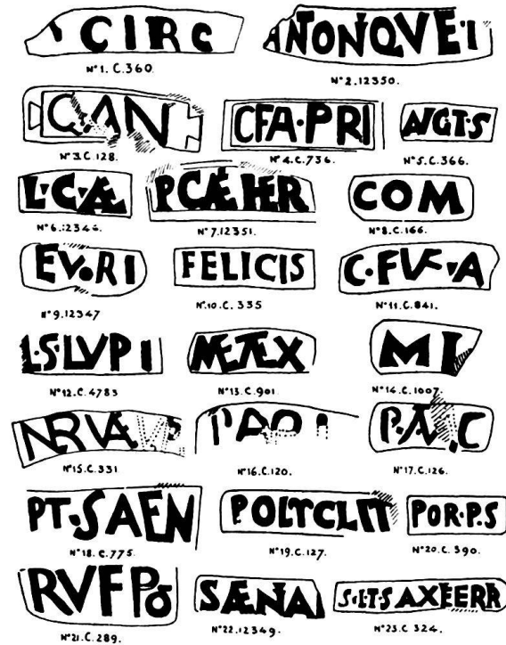
Fig. 2. Amphores de Genève. Estampilles.

Même marque à Sainte-Colombe, CIL, XII, 5683, 10; sans doute aussi à Annecy, 5683, 9a; Allmer, IV, 1519 (CAN), dans un même cartouche à queue d'aronde.