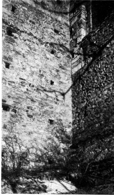
Abb. 8. Winkel zwischen nördl. Querschiff und Seitenschiff.

2. Es ist nun fraglich, ob italienischer Übung entsprechend auch da noch flache Holzdecken oder offene Dachstühle in allen drei Schiffen vorgesehen gewesen seien 1) ; «französische» Einflüsse scheinen mit dem fortschreitenden 12. Jahrhundert mächtiger geworden zu sein, und diesen ist eher eine Einwirkung zugunsten des Übergangs zum Wölbungsbau zuzutrauen. Die Pfeilerabstände und -formen liefern keine sichern Anhaltspunkte für ein bestimmtes