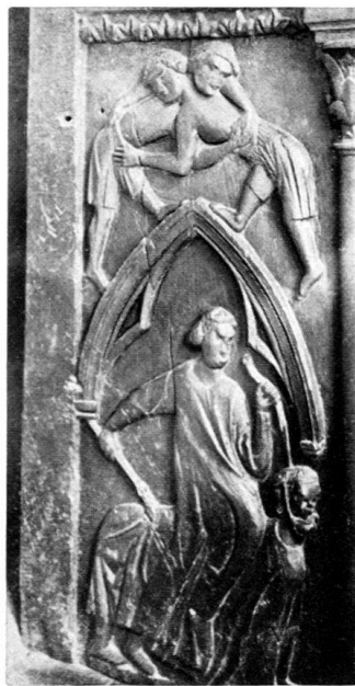
Fig. 4. Lutteurs. Lai d'Aristote.

Cathédrale de Lausanne. Stalles du XIII e siècle: jouées.