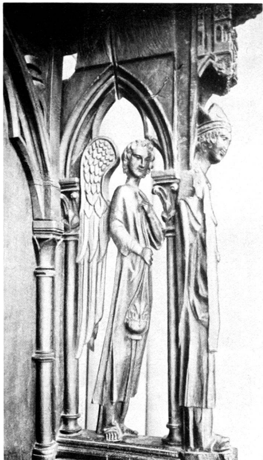
Fig. 1. Evêque et ange thuriféraire.