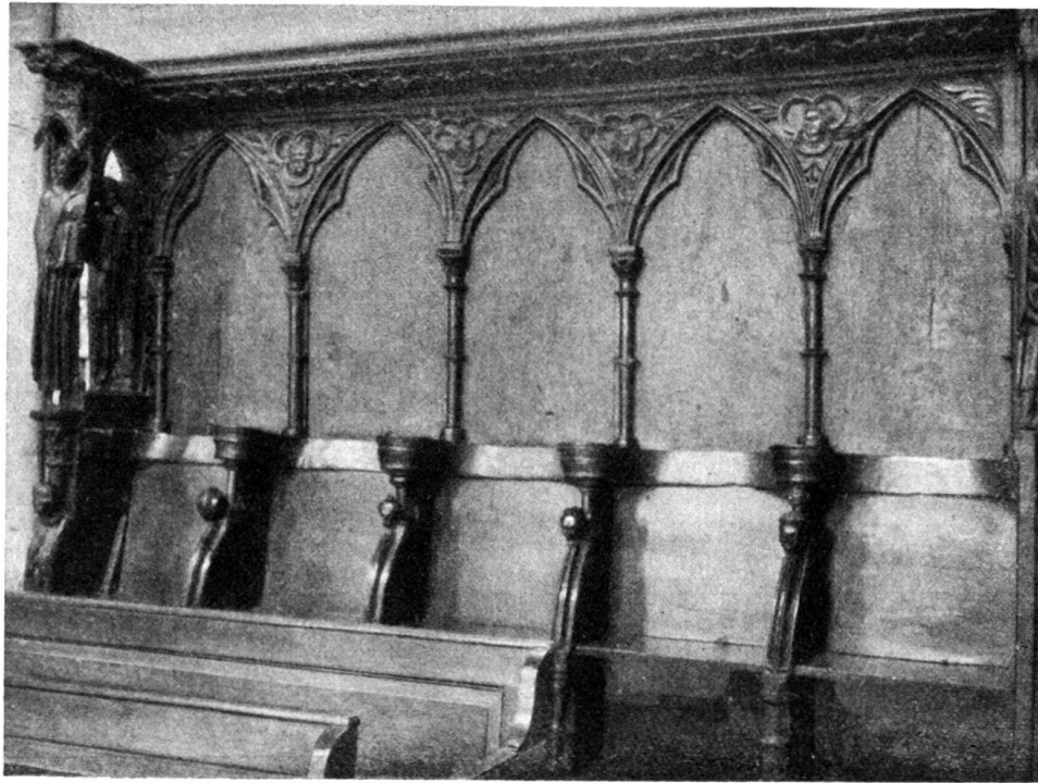
Fig. 1. Cathédrale de Lausanne. Stalles du XIII e siècle. Un groupe de stalles (ensemble)

rosaces analogues à celles de l'entablement extérieur de la Cathédrale. Aux dorsaux se développe une arcature formée d'une suite d'arcs brisés qui reposent sur les chapiteaux de colonnettes au fût interrompu par une bague, comme celui des colonnes du Portail peint ou Porche des Apôtres. Les trèfles qui occupent les écoinçons de ces arcatures (ce motif se retrouve dans plusieurs parties de l'église, notamment à l'arcature des bas-côtés, à certains médaillons de la rose, aux gâbles du porche méridional) sont en général garnis de têtes humaines ou d'ornements végétaux; on y voit un individu coiffé du même bonnet sacerdotal que celui de plusieurs personnages du Portail peint, un homme encapuchonné, une femme, deux visages masculins et enfin une rose. (Voir fig. 1.)