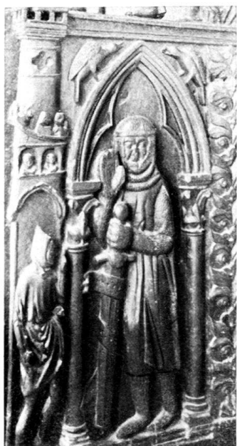
Fig. 3. David et Goliath.