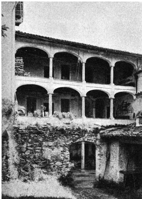
Fig. 4. AGNO. Loggiato seicentesco in Serocca costruito ai tempi di Giov. B. Quadro.

In quell'anno istesso nel quale il Quadro poneva termine al Palazzo di Città, si costruiva una casa propria, per la quale egli doveva affrontare una vertenza giudiziaria assai lunga ed intricata, perchè i suoi avversari, condannati dai tribunali cittadini, si appellarono fino al tribunale del Re di Polonia. E' interessante, per la storia, la lettera che, in detta occasione, i dirigenti del Consiglio di Posen scrivevano al Gentiluomo Peter, regio medico nella città di