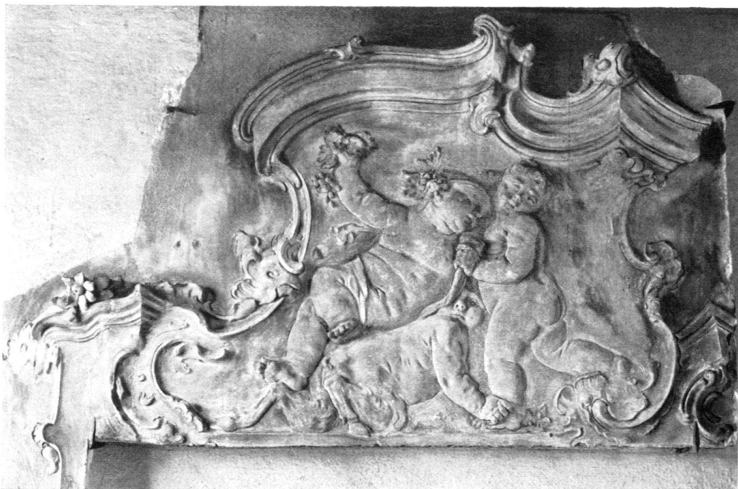
Fig. 7—8. Stucchi di Giovanni Rodolfo Furlani da Montagnola (vedi pag. 265). AGNO. Casa prepositurale.