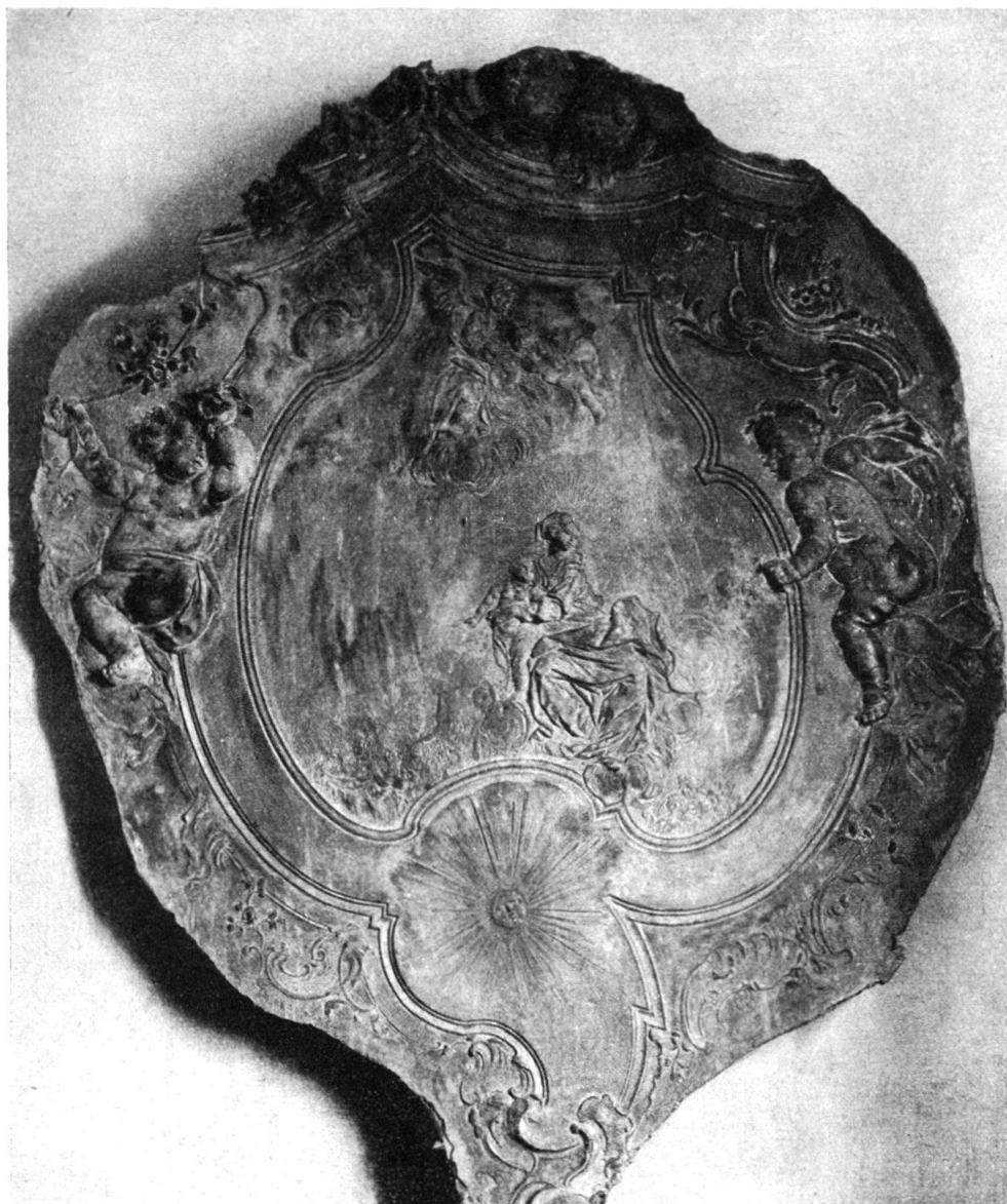
Fig. 5. Stucco di Giovanni Rodolfo Furlani da Montagnola (vedi pag. 265). AGNO. Casa prepositurale.

Sette anni dopo, nel 1577, egli otteneva dell' altro, ossia la costruzione di un fabbricato, probabilmente una tettoia, per il servizio della fornace, dietro pagamento di un' annuo canone di 5 marche d' argento, da raddoppiarsi qualora il fabbricato fosse ingrandito, come di fatto avvenne.