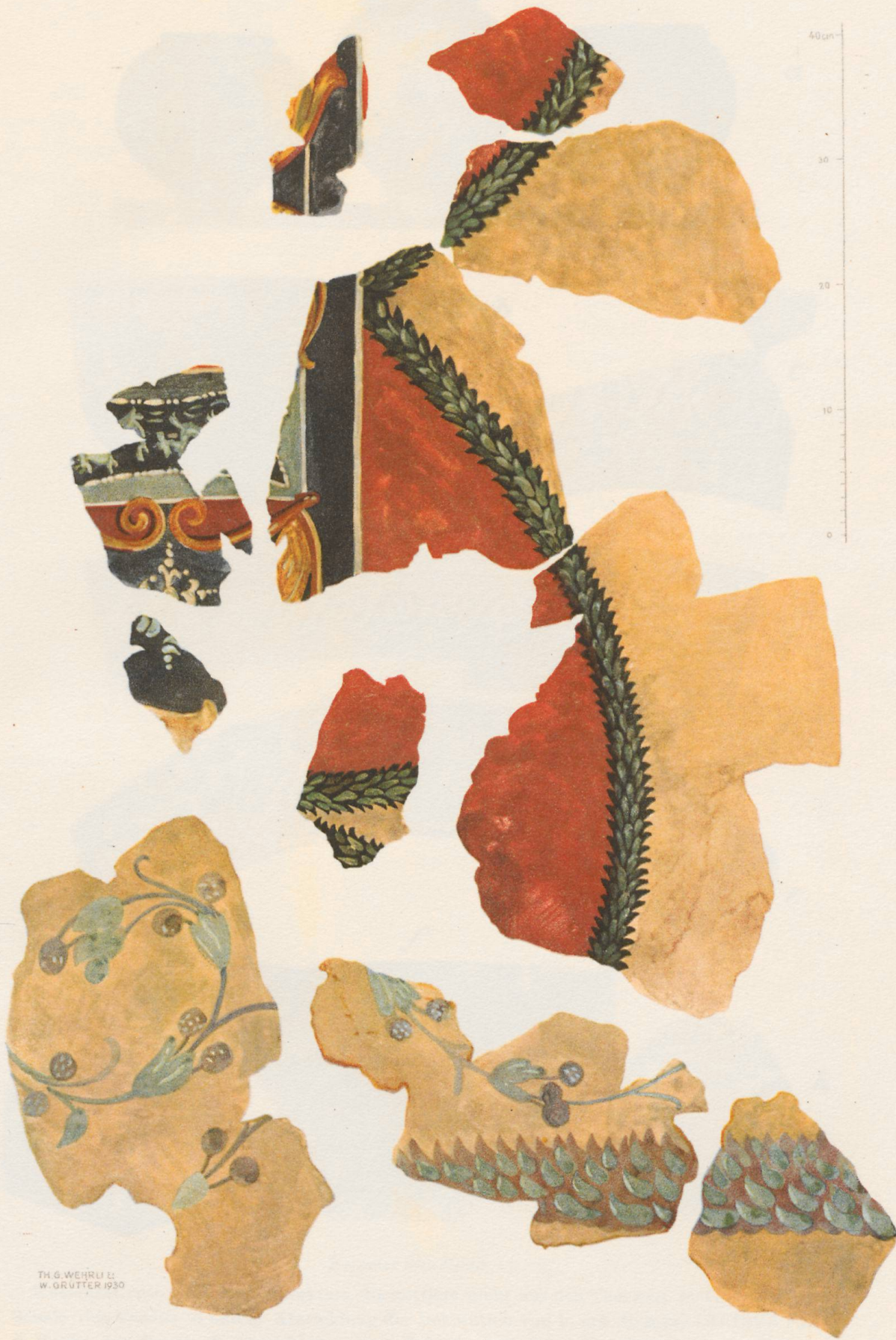
WANDMALEREIEN AUS DEN THERMEN VON VINDONISSA