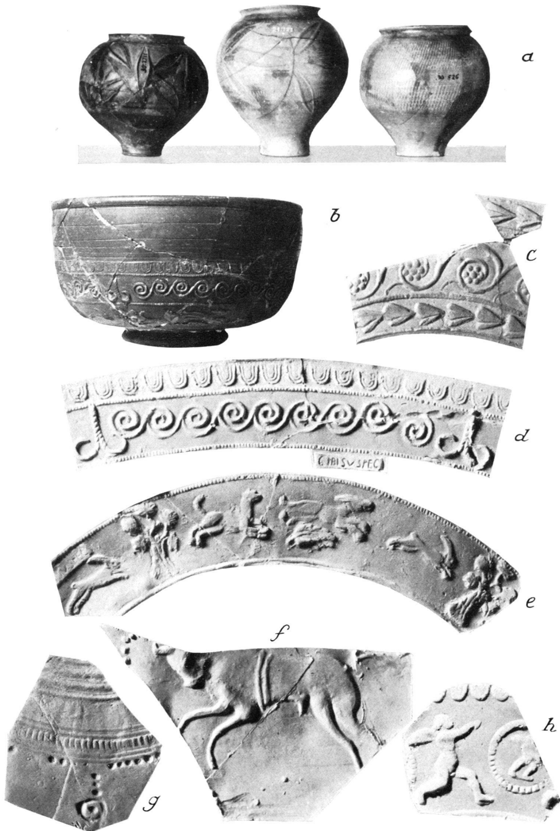
Keramik aus Raum 17.

a) Kugelige Urnen rätischen Charakters, die mittlere nicht aus den Thermen. b) Terra sigillata-Schale des Cibisus. d und e) Abwicklung der Dekoration von b, mit Stempel CIBISVS FEC. c) Ranke des Janus. f) Abwicklung einer Scherbe mit Barbotine-Dekor, einen springenden Stier mit Gurtband darstellend. g) Randstück zu f, oben anpassend. h) Terra sigillata-Scherbe des Cibisus mit geriefeltem Eierstab. (Die Gefäße 1:4, die Abwicklungen 1:2.)