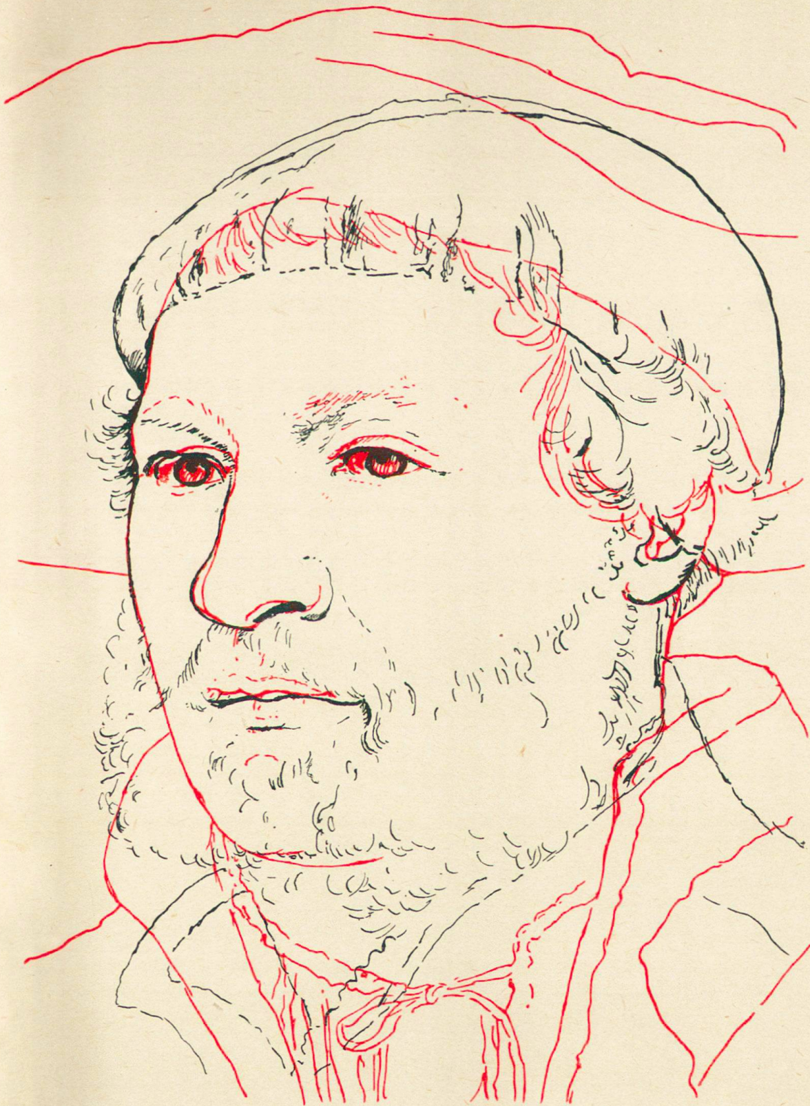
Das angebliche Selbstbildnis in Basel (rot) annähernd originalgroß und das Selbstbildnis Holbeins in den Uffizien (schwarz), auf die gleiche Pupillendistanz reduziert.