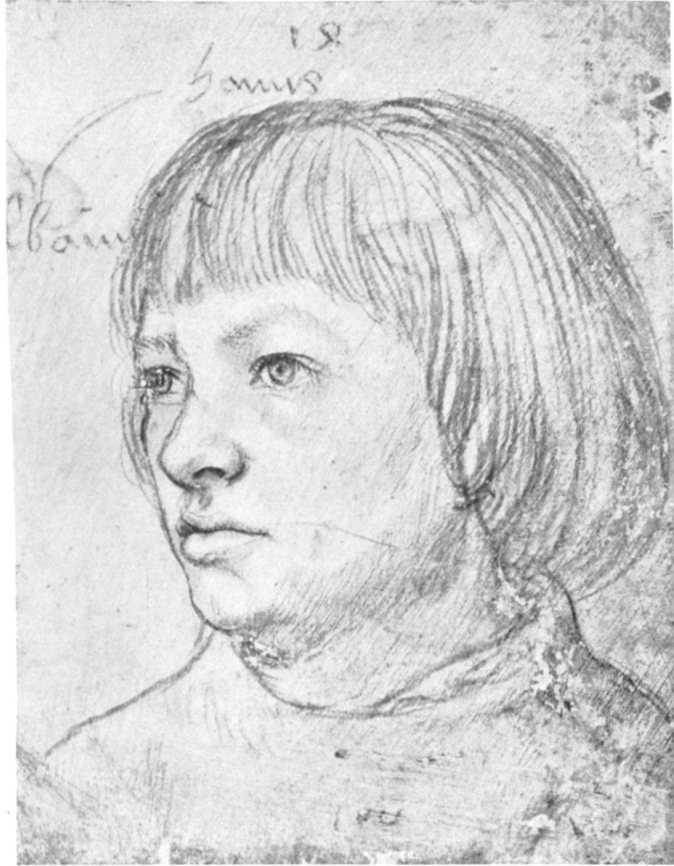
H. Holbein d. Ä., Holbein d. J. mit 14 Jahren. Silberstiftzeichnung in Berlin.