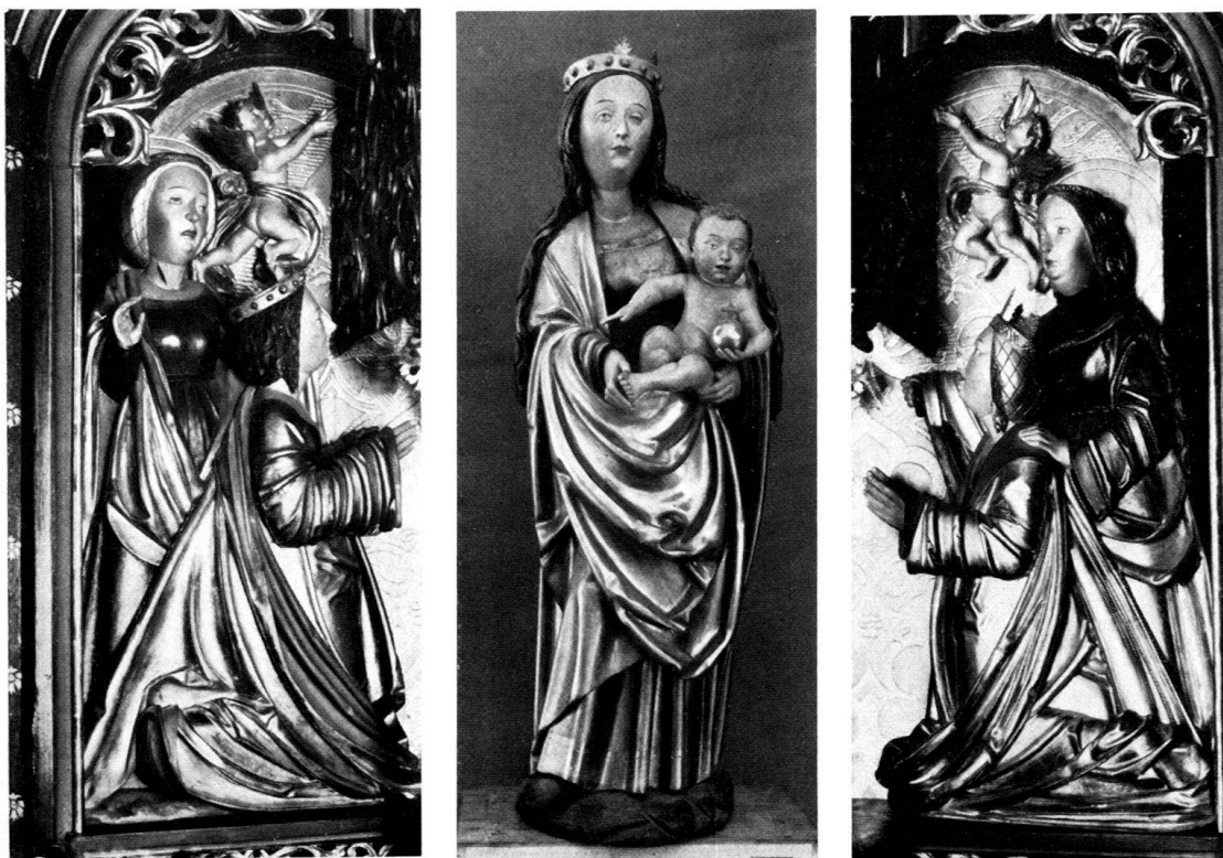
Abb. 2. Vigens, Pfarrkirche. Hochaltar, Schreinfiguren (ehem. Aufstellung).