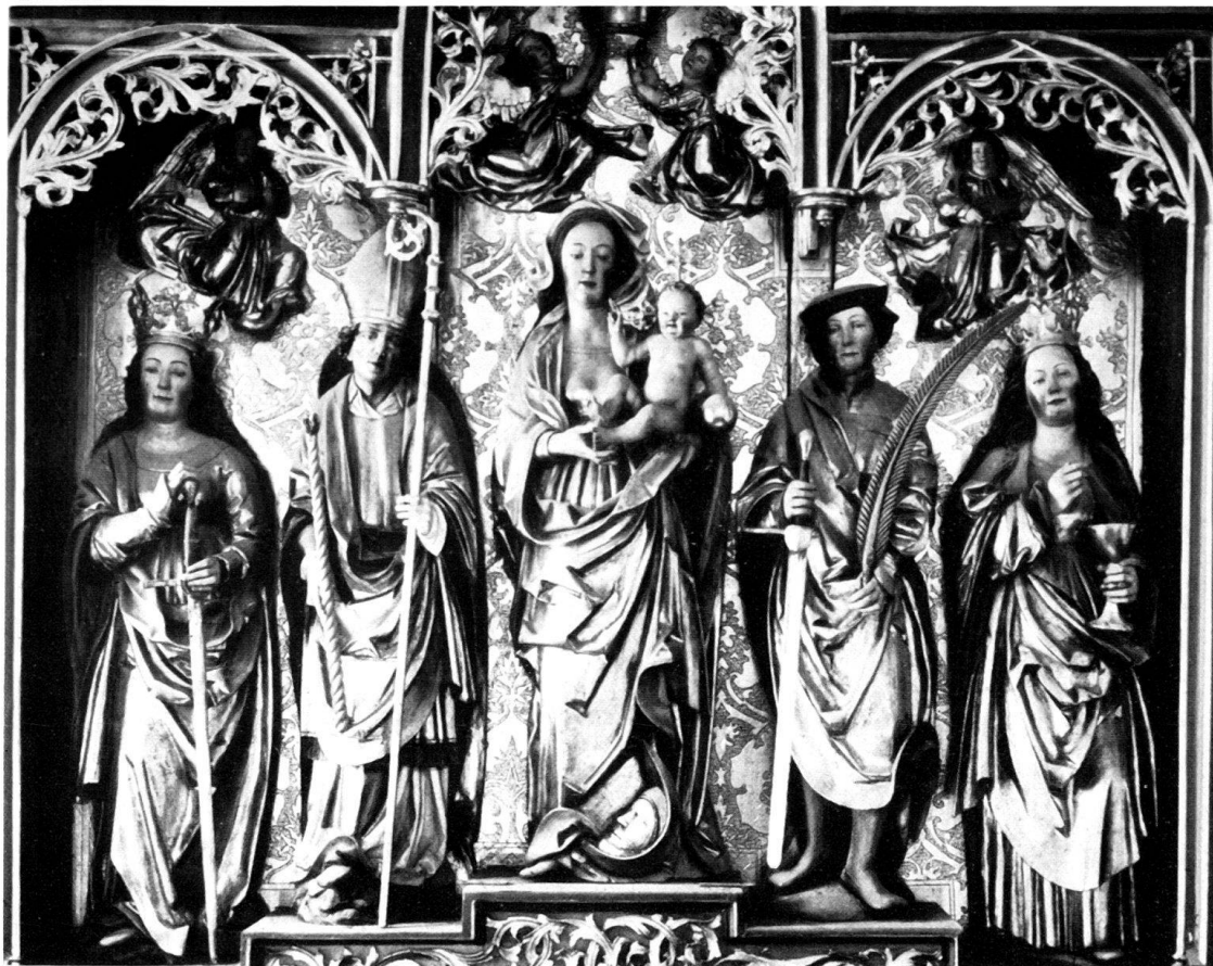
Abb. 1. Tinzen, Pfarrkirche, Hochaltar, Schrein.