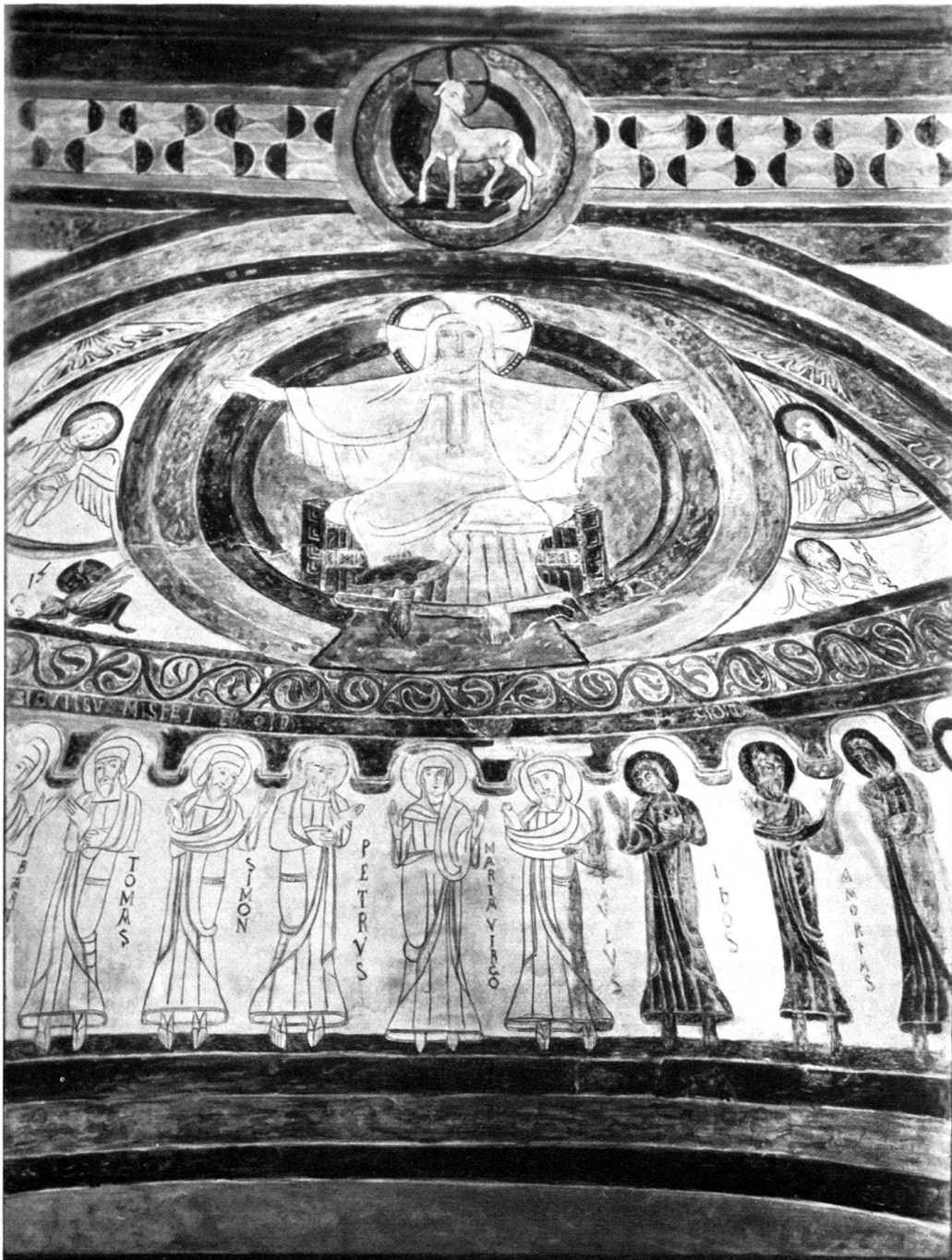
Fig. 2. Eglise de Montcherand.