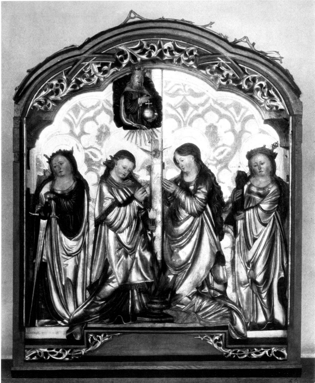
Abb. 3. Zürich, Landesmuseum. Altar aus Seewis, Schrein.