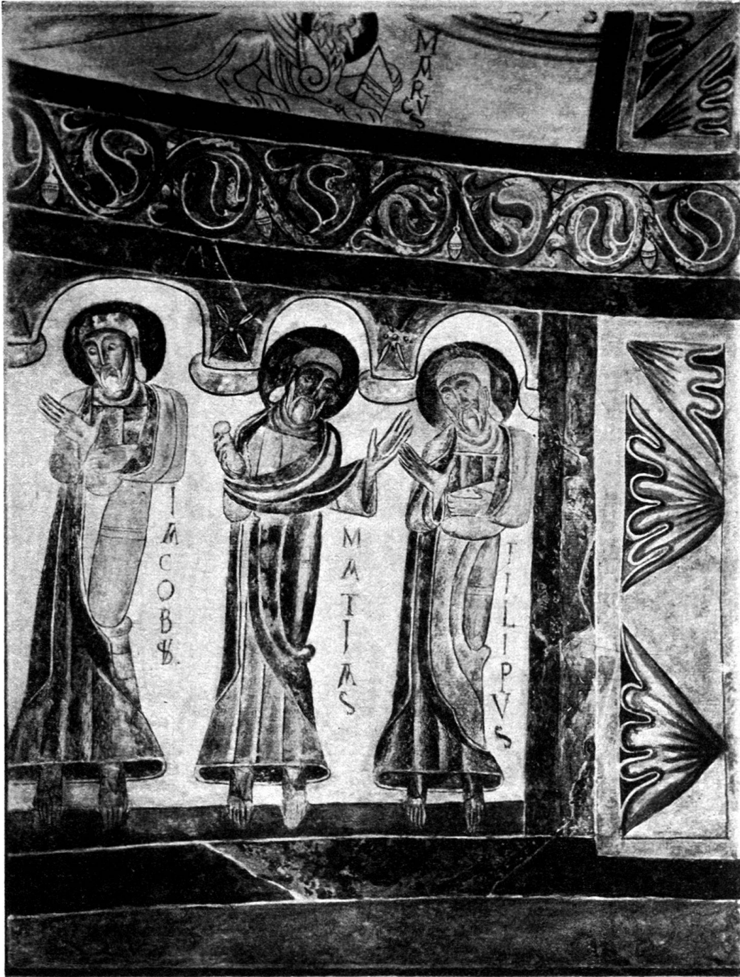
Fig. 3. Eglise de Montcherand. Fresques de l'abside. Trois apôtres d'après un relevé d'Aug. Schmid.

comparons le chœur de cette église aux nombreux édifices romans de France, un rapprochement s'impose: le porche du prieuré Saint-Fortunat de Charlieu (fig. 5). La similitude avec notre église est saisissante: le Dieu de majesté dans sa gloire, les animaux du tétramorphe, les douze apôtres encadrant la Vierge,