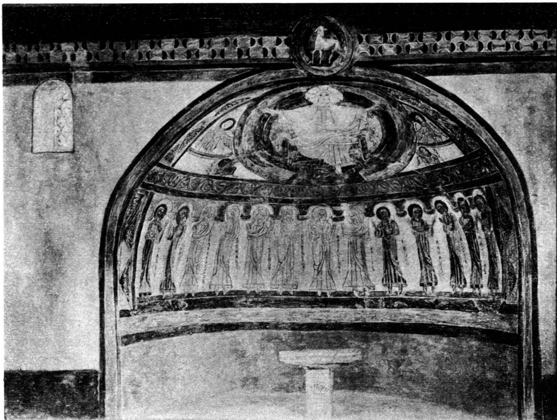
Fig. 1. Eglise de Montcherand. Fresques de l'abside: ensemble d'après un relevé d'Aug. Schmid.

et-Cher), à Poncé (Sarthe), à Saint-Philibert de Tournus (Saône-et-Loire). Au centre de cette frise, entouré d'une gloire circulaire, se profile l'Agneau de Dieu les pieds posés sur le Livre de Vie. Fait intéressant, à quelques détails près, il est presque calqué sur l'Agneau peint au sommet du doubleau qui précède le chœur de l'église de Montoire 1 ). L'arc triomphal est souligné, du côté de la nef, par une bordure composée de trois galons alternativement bruns et jaune.