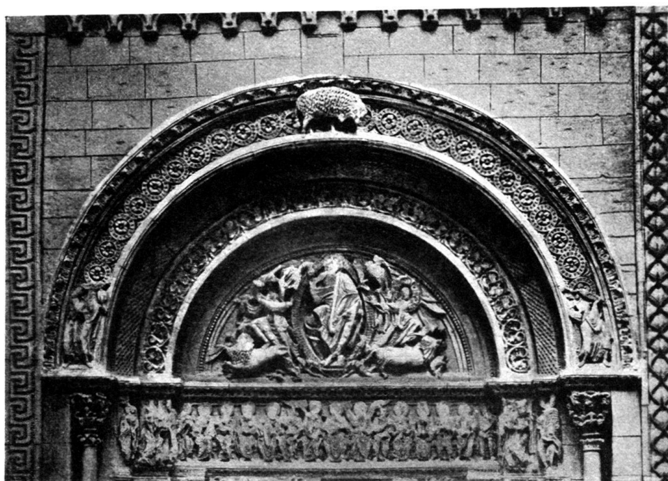
Fig. 5. Eglise Saint-Fortunat de Charlieu (Loire). Tympan du porche. L'Agneau de Dieu, le Dieu de majesté, la Vierge et les apôtres.