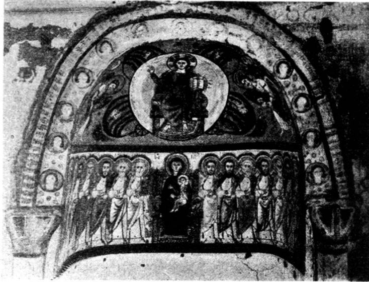
Fig. 6. Monastère de Baouît (Haute-Egypte). Première abside.

Le Dieu de majesté, la Vierge et les apôtres, médaillons de vertus.