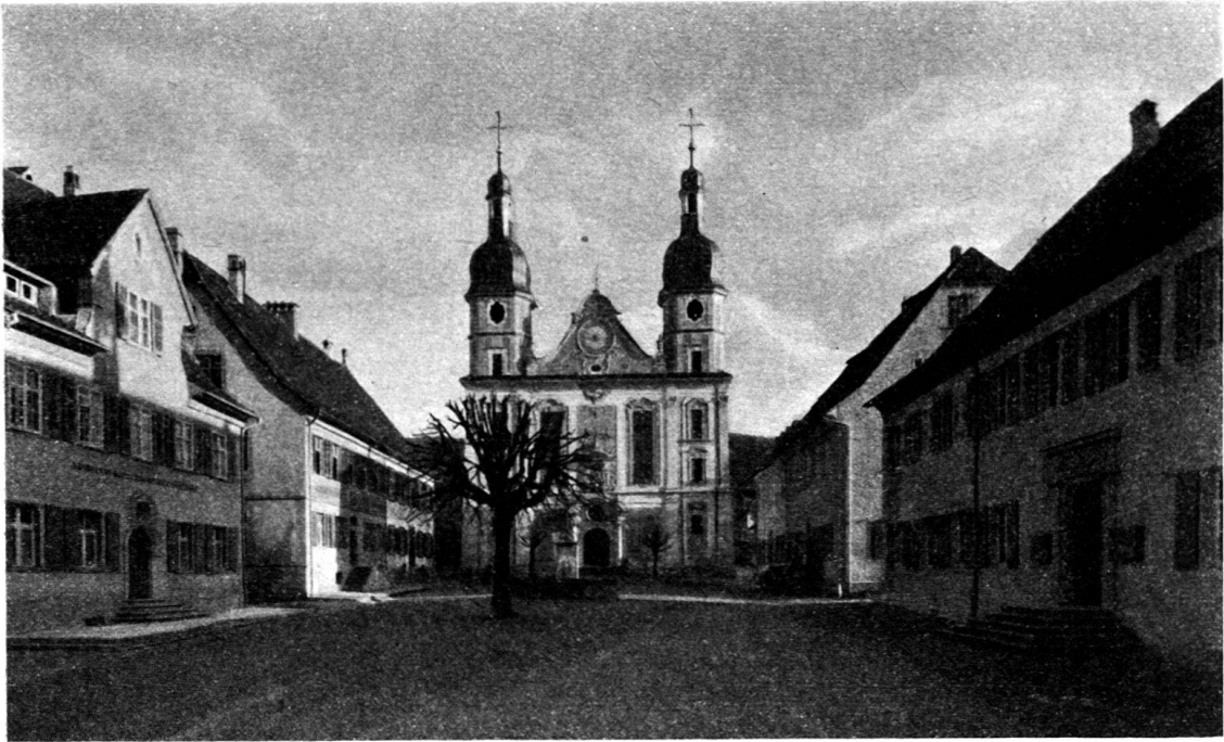
Arlesheim, Domplatz. Heutiger Zustand.

schuldiget, das weder er noch sein brueder, weillen Ihnen von Ihrem gnädigsten Fürsten vndt Herren zue Aystätt bey hoher straff verboten worden, von danen nit hinweg zureißen, weillen man Ihrer günt in brandt gerathener fürstl. residentz daselbsten zue deren reparierung hoch vndt ohnentbährlich von notten habe.»