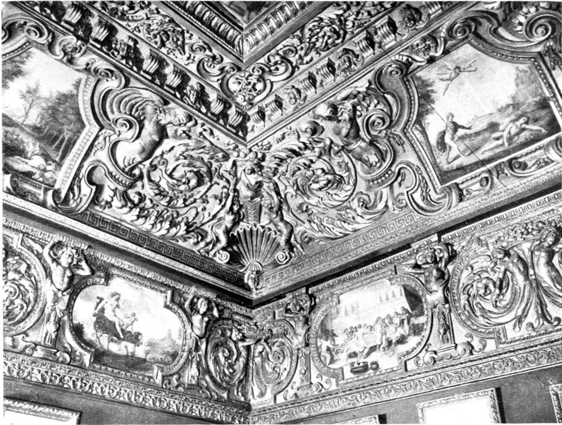
Fig. 5. Andrea Casella da Carona: Soffitto decorato a stucchi e scene mitologiche. Torino, Castello del Valentino. Sala Verde.