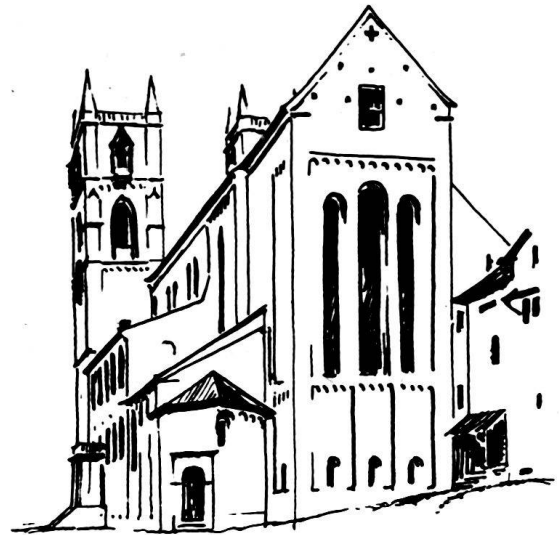
Klissee Schweiz. Bauzeitung. Nach Zeichnung von H. Wiesmann.

Das Großmünster um die Mitte des 13. Jahrhunderts.