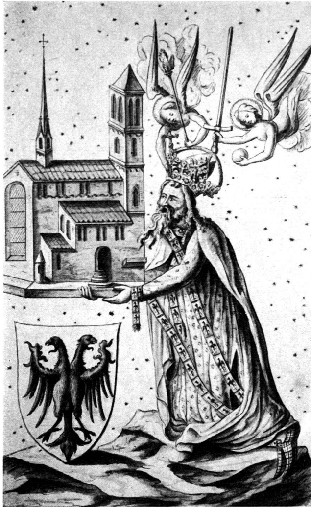
Abb. 2. Tafelgemälde. Karl der Große als Stifter des Großmünsters.

Kopie in laviertem Tuschzeichnung, 18. Jahrhundert.