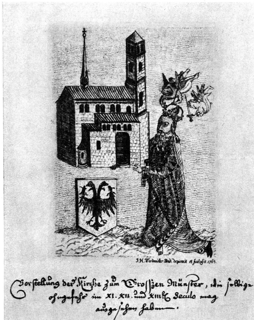
Abb. 1. Kopie eines verschollenen Tafelgemäldes mit dem Bilde Karls des Großen, als Stifter des Grossmünsters.