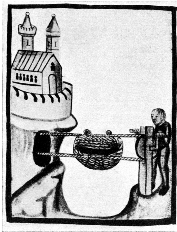
Abb. 1. Seilschwebebahn, 1411. Wien, Staatsbibliothek. Ms. Nr. 3069.

Geschütze nebst weiterer Mannschaft. Am 17. August traf die ganze Streitmacht von Basel mit Zuzügen von Solothurn und Bern in der Stärke von ungefähr 5000 Mann vor Rheinfelden ein, wozu dann noch am 21. d. M. die Hauptbanner von Bern und Solothurn mit weiteren 3000 Mann und drei Hauptbüchsen und sonstiger Artillerie kamen. Im ganzen lagerten gegen 8000 Mann mit fünf großen Büchsen, 300 Handbüchsen und Feldgeschützen in zwei Lagern, das eine östlich der Stadt beim St. Johanneshaus, das andere westlich längs der Straße nach Basel, in der sogenannten Klos. Hier auf dem Areal der früheren Zündholzfabrik, wo sich heute die Kurbrunnenanlage befindet, waren die Hauptbüchsen in einer Entfernung von 160 m von der Burg