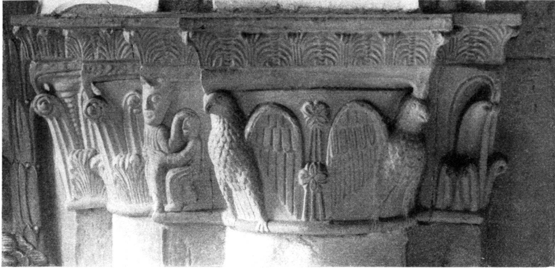
Abb. 14. Chur, Dom. Am südlichen Pfeiler der Westwand. Jakob und der Engel. Die Weltgerichtsadler.

Gefieder und dazu noch um das Haupt einen Nimbus, und zwar den Kreuznimbus, denn er bedeutet die Auferstehung in der Ähnlichkeit und Herrlichkeit Christi. Zu ihm wendet sich das Lamm, weg vom schlimmen Adler zu seiner Linken, dessen Federkleid struppig ist. Diesem fehlt der Nimbus; er bedeutet die Auferstehung in Häßlichkeit zum Gerichte der Verdammnis. Diese Zusammenstellung in Gernrode nimmt die Adler als Symbole der Auferstehung und des Gerichtes zugleich, ordnet sie an im Sinne der Scheidung zur Rechten und Linken. In den vorhergenannten Beispielen war kein Mittelbild zur Aufklärung und Orientierung da, weshalb die Beachtung der Himmelsrichtung geboten war: Osten oder Süden als Lichtseite, Westen oder Norden als Nachtseite. Die Adler von Gernrode sind heraldisch geordnet zum Lamme, dem Richter, nach der Symbolik von Links und Rechts. Am hl. Grabe von Gernrode haben wir, wenn nicht das Urbild, so doch den Grundgedanken des Motivs, das über Chur, Schöngrabern und Wien seine Vereinfachung und Abschleifung erfuhr.