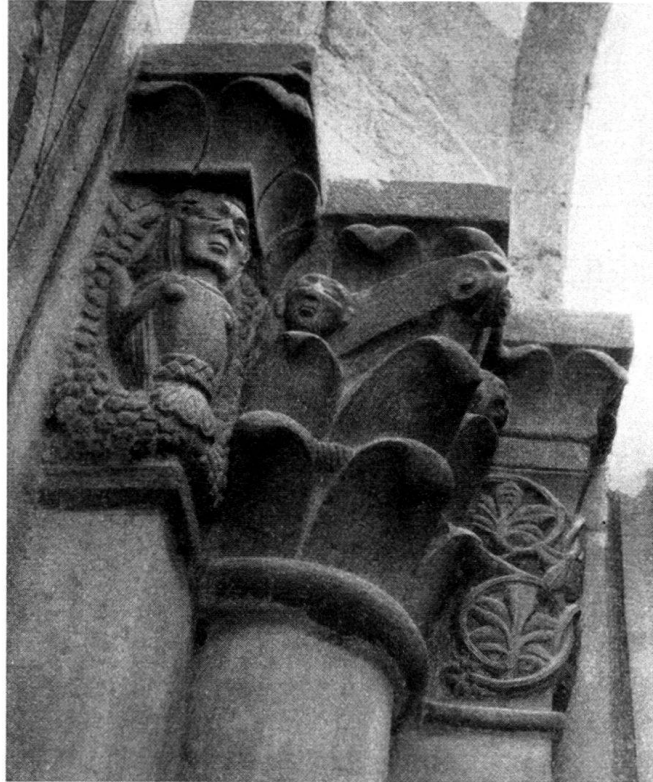
Abb. 11. Chur, Dom. Kapitelle im Chor, Südseite. Taufsymbolik.

östlichen Arkade sitzt ein Mann mit Bart, mit langem Gewande und Überwurf; er legt die Rechte im Trauergestus an die Wange und ruht in Sorgen eingeschlafen.