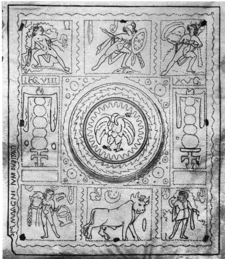
Abb. 3. Die Schildbuckelplatte der VIII. Leg. aus dem Tyne in London. 27,5 × 25 cm.

buckel der VIII. Legion (Abb. 3) 11) , dessen Reproduktion von der Direktion gütigst erlaubt wurde. Auf den ersten Blick ist die Verwandtschaft zwischen den beiden Stücken wahrzunehmen. Ist auch die Schildbuckelplatte aus Vindonissa einfacher und weniger reich verziert, so stimmt doch die Ausführung der Einzelheiten genau überein. Gleich aufgeteilt ist die ganze Fläche. Hier, wie dort sind die Felder durch gepunzte Doppellinien voneinander abgetrennt, die Silberbelag aufwiesen. Gepunzt sind bei beiden Stücken auch die Buchstaben, von denen sich die G sehr ähnlich sind. Ganz gleich sind die Drei- und Vierpunktblüten, die Girlande kleiner Bögen, und endlich stimmen auch die beiden Marsfiguren weitgehend überein. Körper und Mantel sind eingraviert, nicht gepunzt, die Locken sind vorn aufgebogene, fast parallele Linien, die Muskulatur ist mit wenig Strichen und sicher gezeichnet. Dieselbe Behendigkeit und Jugendlichkeit spricht aus der Stellung und Gesamthaltung. — Ein gepunzter Mond ist auch am Londoner Schild vorhanden. (Der Stier war für Cäsar das Abzeichen des julischen Hauses, der Mond aber eigentliches Nativitätsgestirn.) So erlaubt der Stilvergleich auf dieselbe Werkstatt, wenn nicht gar auch auf denselben Verfertiger zu schließen. Dazu kommt noch die Übereinstimmung im Beinamen der Legion, was endgültig entscheidet, daß die Schildbuckelplatte einem Angehörigen der VIII. Legion zuzuweisen ist.