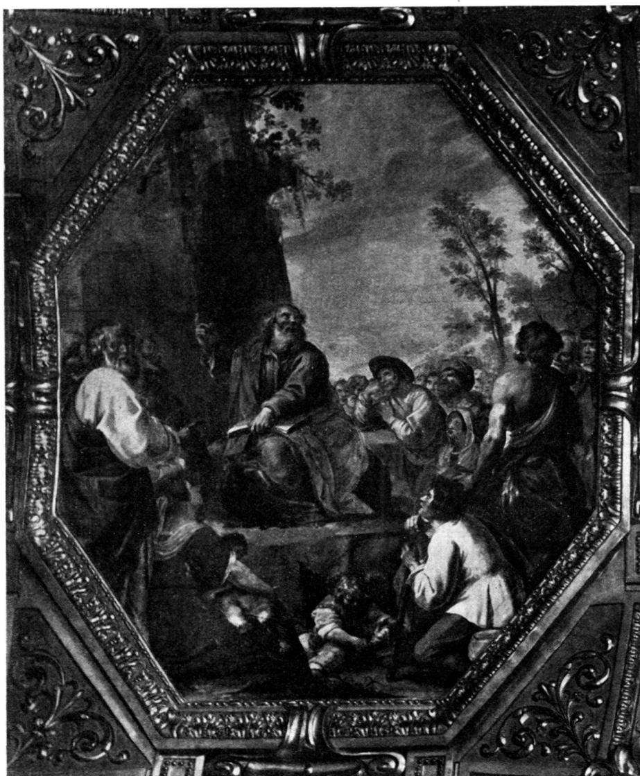
Fig. 4. La predicazione di S. Matteo, di Giovanni Battista Carlone, nella Basilica della SS. Nunziata del Guastato in Genova

nunziata 33 ); la donna seduta in primo piano col bambino in braccio, il giovane contadino inginocchiato di fronte a lei, quello ritto dietro di esso ed appoggiato al rialto su cui sta l'apostolo riproducono, l'ultimo soprattutto, volti, pose, atti delle corrispondenti figure genovesi in maniera sorprendente; quasi identico poi è lo sfondo.