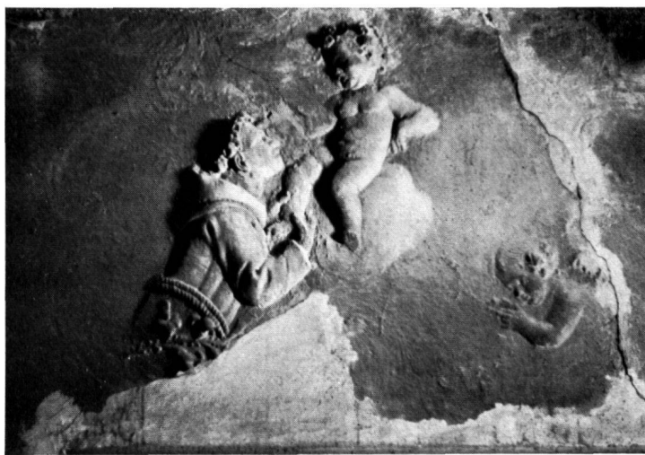
Fig. 7. S. ANTONIO COL BAMBINO