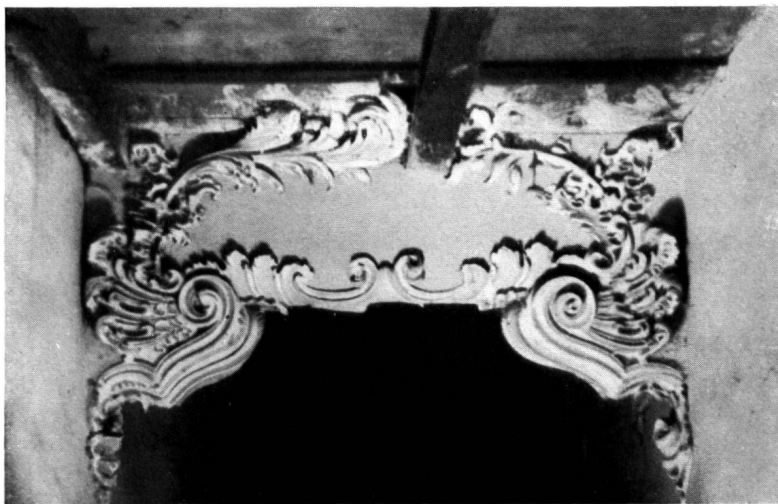
Fig. 4. SOPRAPPORTA