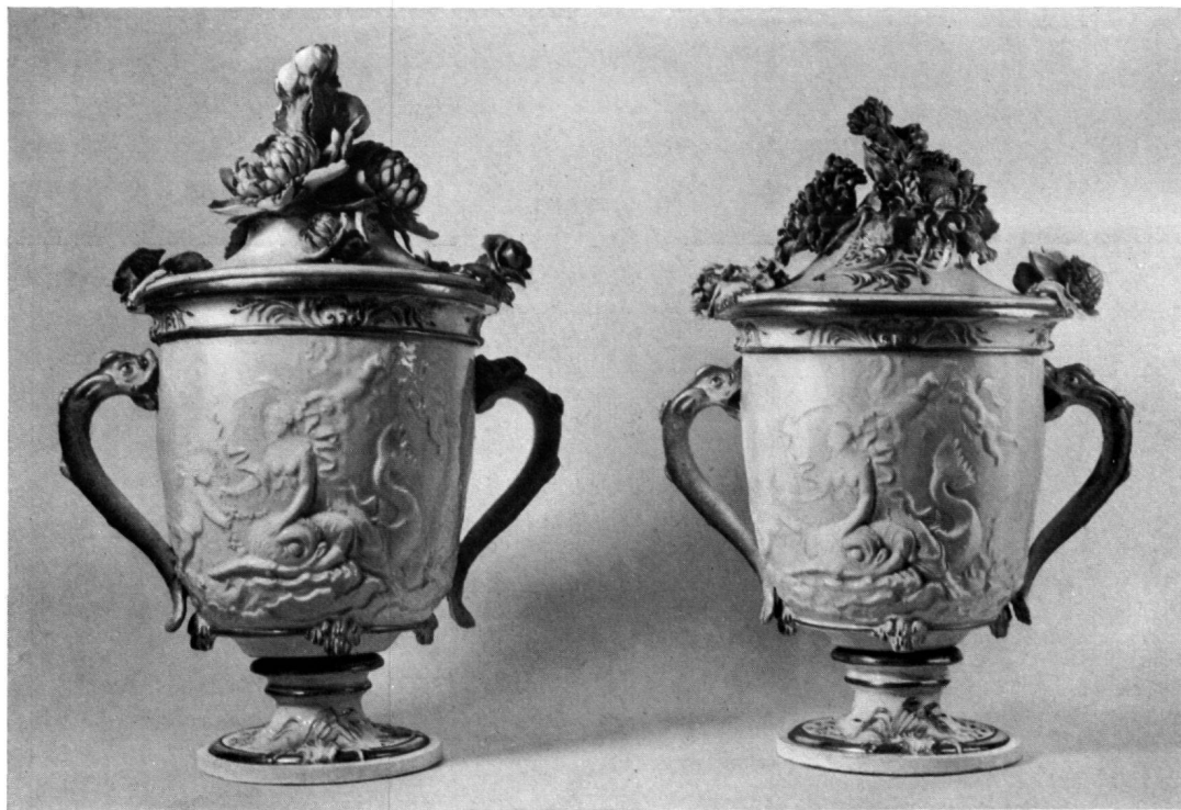
Fig. 10. VASI DI G. B. PEDROZZI. MANIFATTURA DI BERLINO 1765/66 Berlino, Schlossmuseum