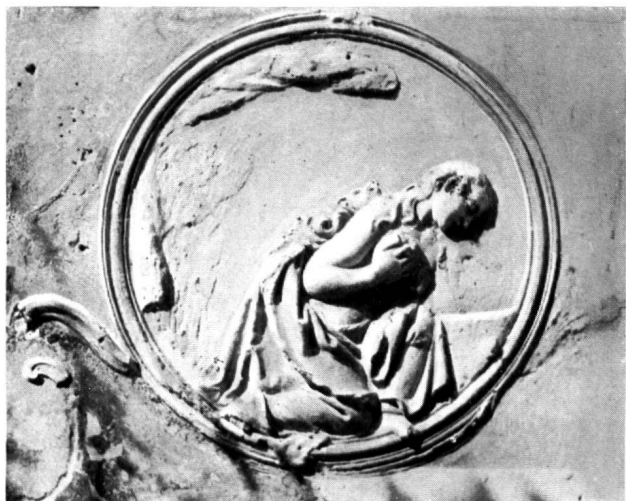
Fig. 6. MADDALENA PENITENTE SULLA FACCIATA