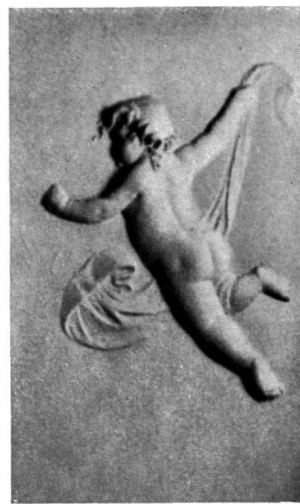
Fig. 5. PUTTO VOLANTE