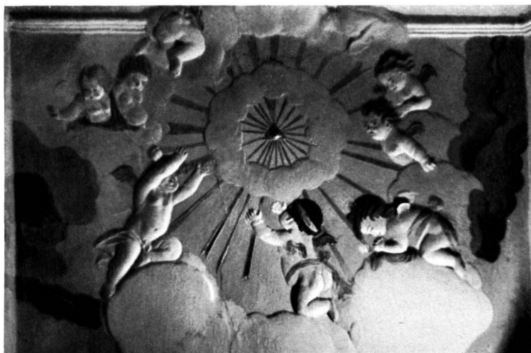
Fig. 8. GLORIA DI PUTTI STUCCHI DELLA CASA PEDROZZI A PREGASSONA