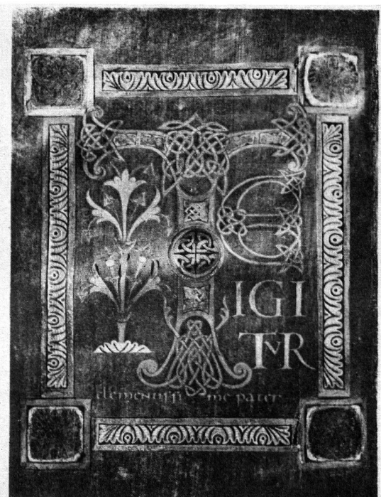
Abb. 3-4 SAKRAMENTAR VON CORBIE Paris, Bibl. nat. lat. 12051, fol. 7 v und 8 v (nach Boinet)