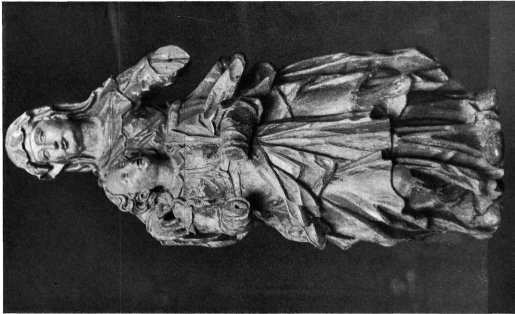
2. HOLZPLASTIK AUS SURSEE