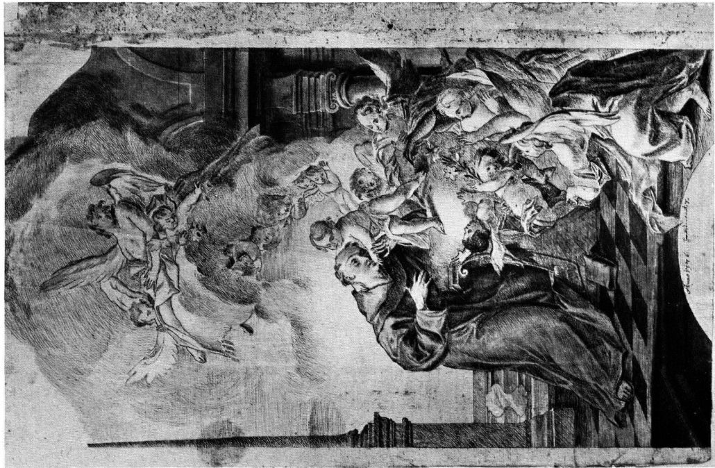
Getuschte Federzeichnung, signiert: «Anno 1776. Herbstmonat FTL» Einsiedeln, Stiftssammlung