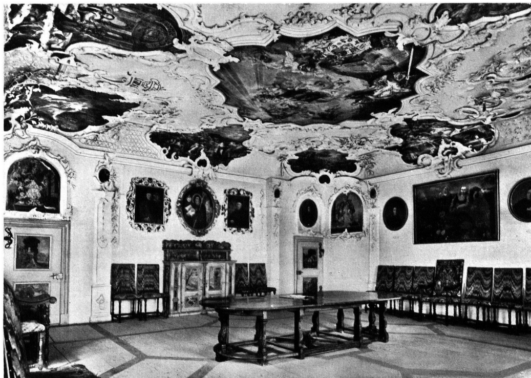
Schloß Sonnenberg (Kt. Thurgau), Festsaal. Vgl. Nachrichten S. 69