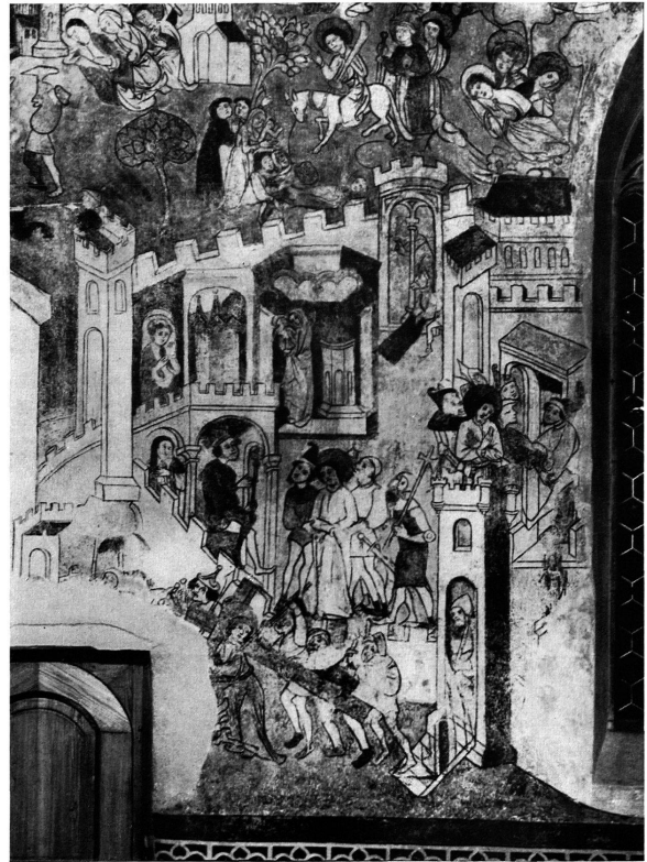
n. Phot. im Archiv f. hist. Kunstdenkmäler, Schweiz. Landesmuseum Scherzligen, Kirche. Wandmalerei auf der Südwand. Nach der Restauration 1944 Vgl. S. 66