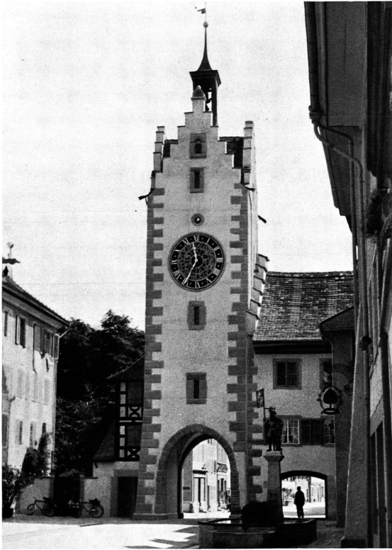
Dießenhofen, Siegelturm. Westfassade. Nach der Renovation 1943/44 Vgl. S. 69