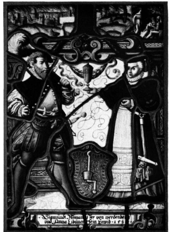
4 Scheibe Winawieser-Lipuner, Werdenberg, 1585