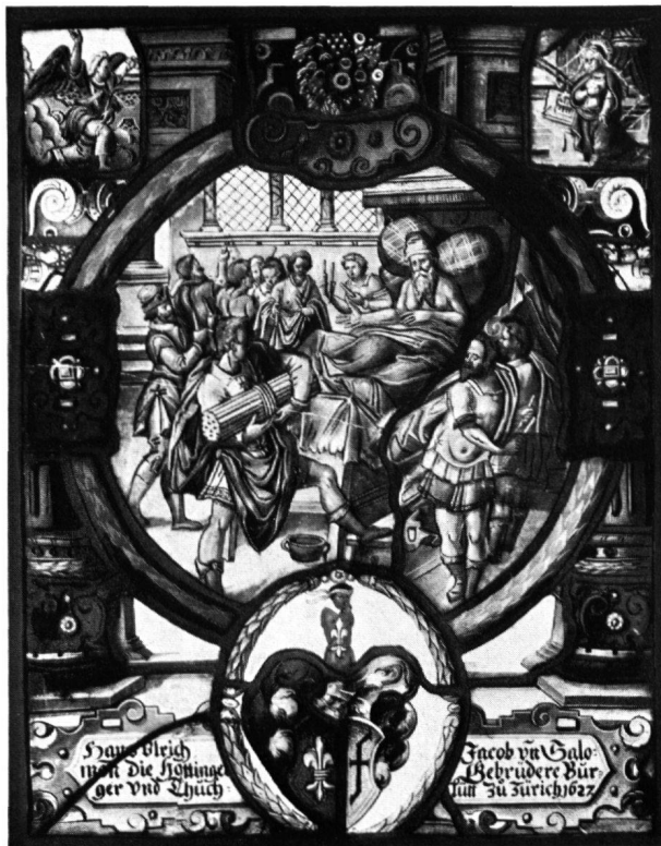
11 Scheibe der Gebrüder Hottinger, Zürich, 1627