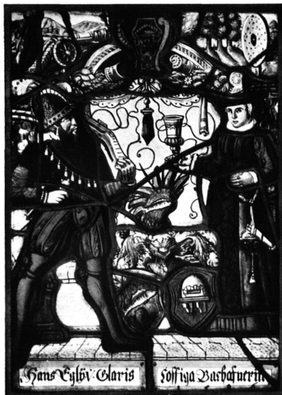
5 Scheibe Egli-Bachofner, Glarus, 1586