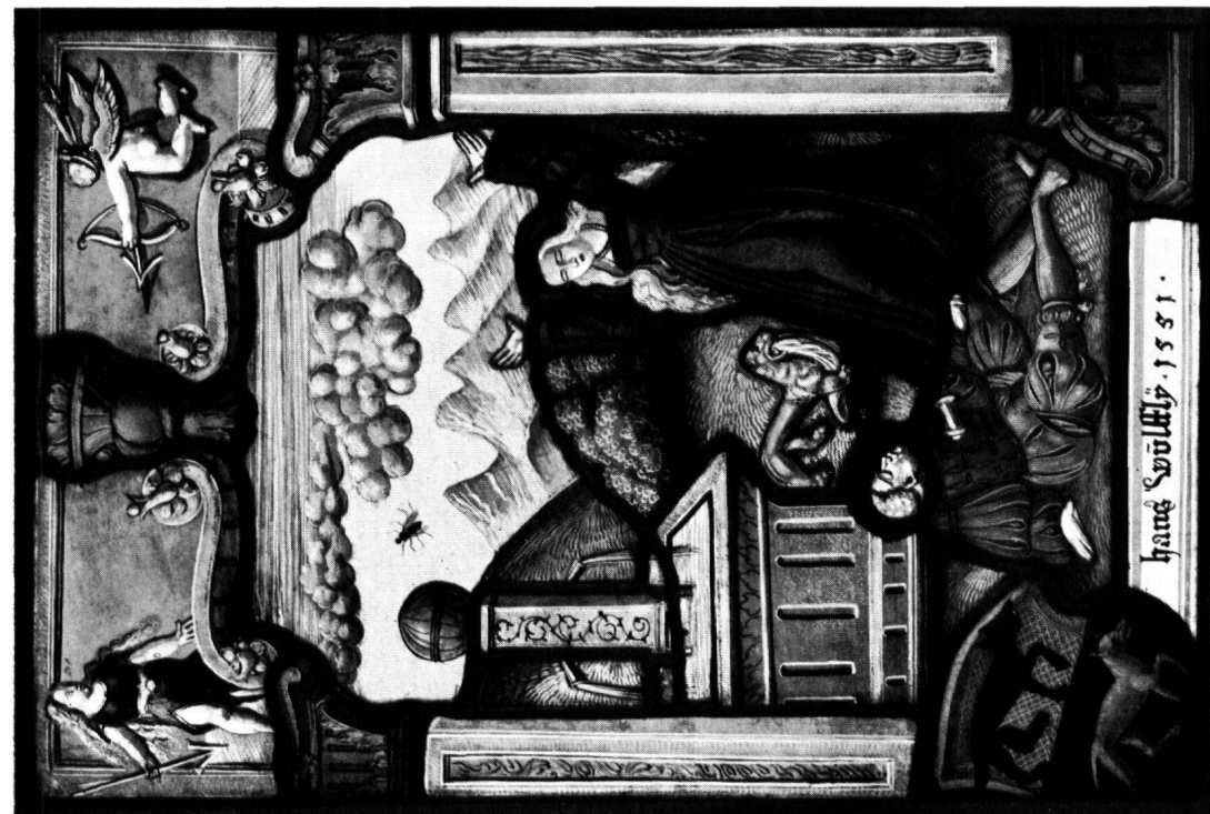
8 Scheibe Hans Wulffly, 1551