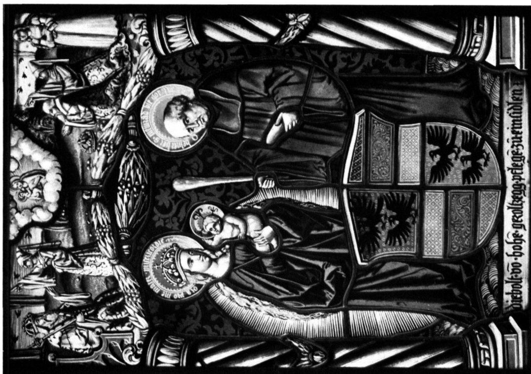
7 Diebold von Hohen-Geroldseck, Pfleger zu Einsiedeln, um 1520