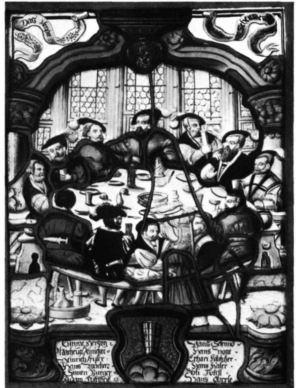
10 Scheibe des Gerichtes Schenkenberg, um 1560