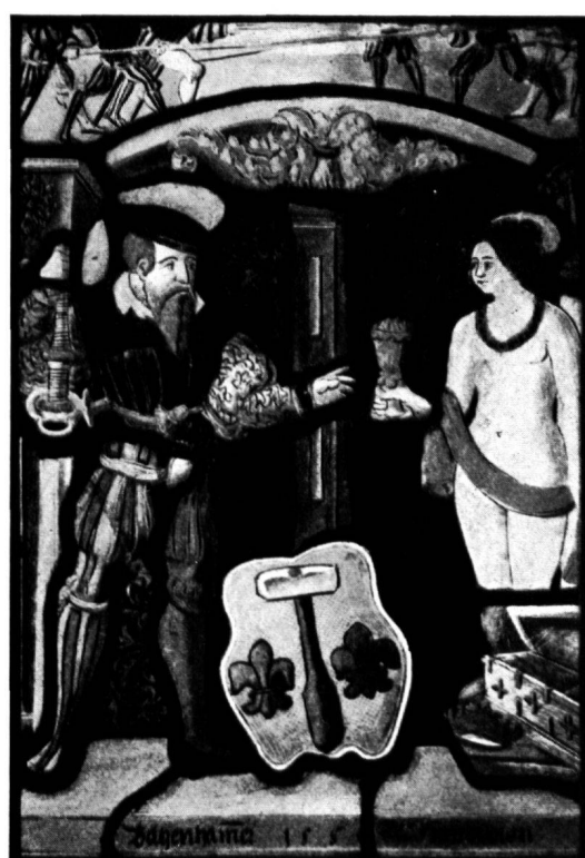
16 Scheibe Hauptmann Batzenhammer, 1550