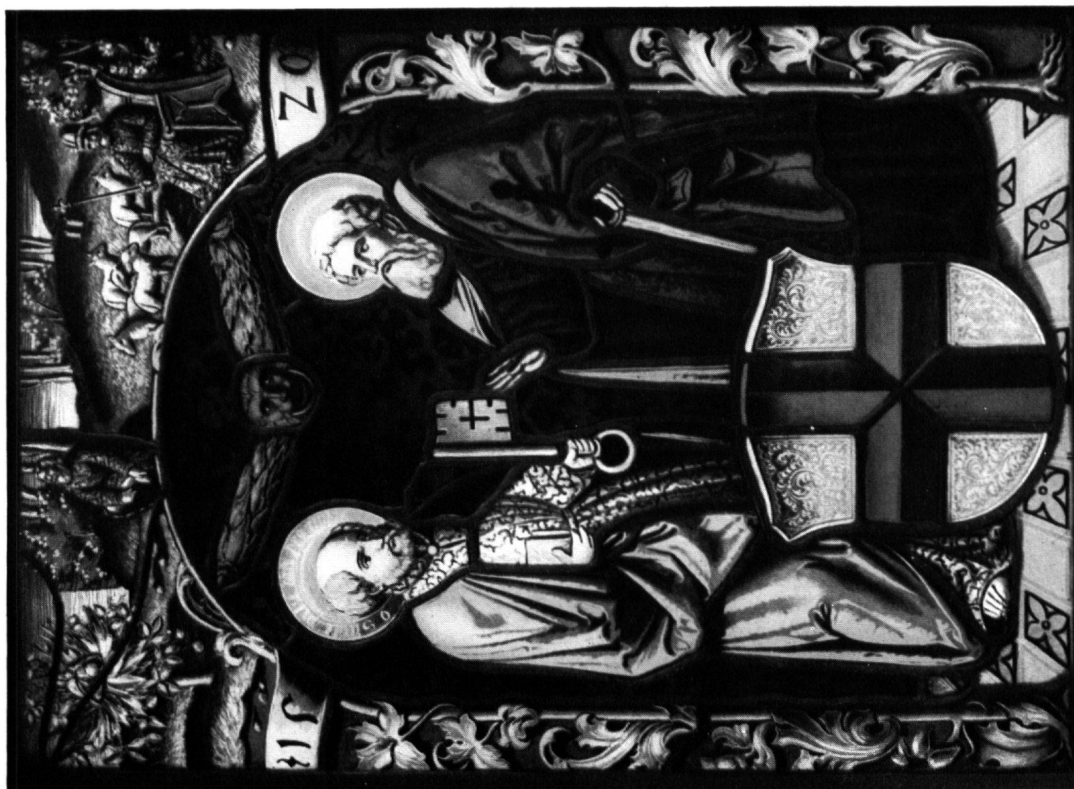
2 Propstei Oehningen (mit falschem Wappen), 1520