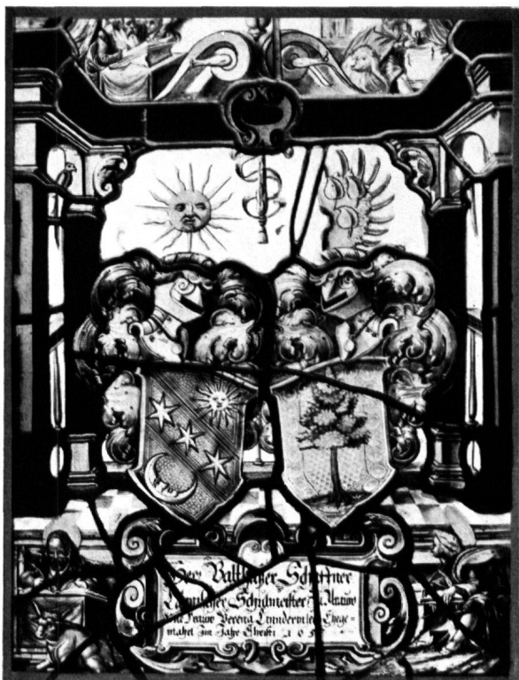
13 Scheibe Schaffner-Linder, Aarau, 1652 (?)