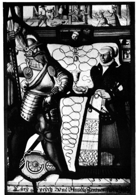
6 Scheibe Speich-Zentner, Glarus, 1595