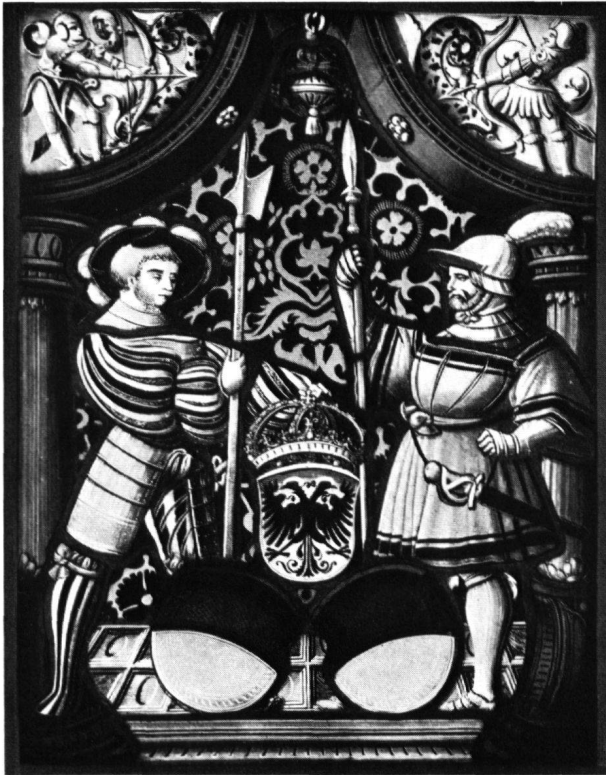
9 Standesscheibe von Unterwalden, um 1530