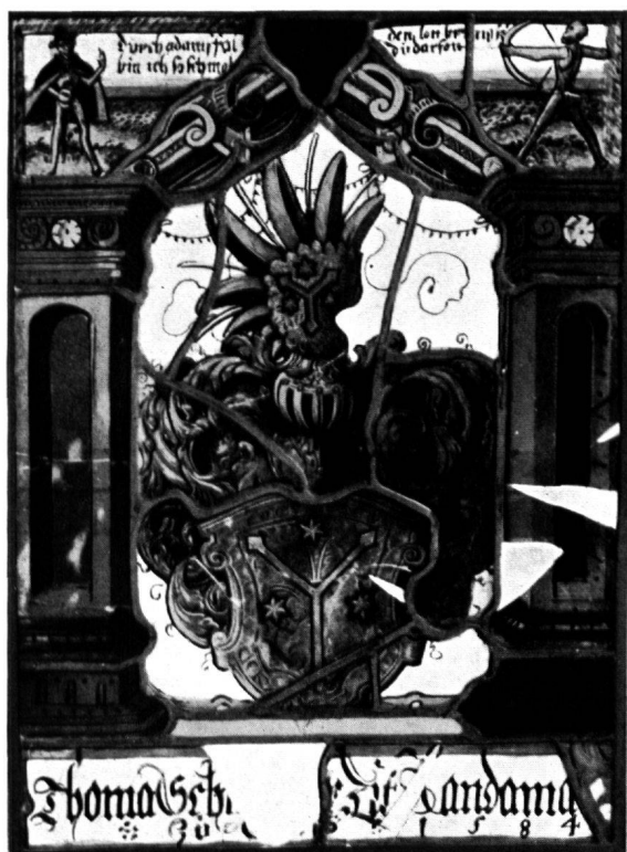
15 Scheibe Thomas Schmid, Glarus, 1584