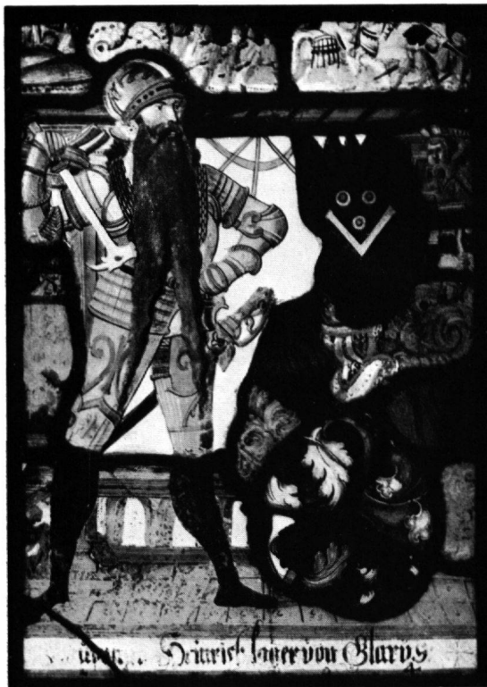
3 Scheibe Hptm. Heinrich Lager, Glarus, 1594