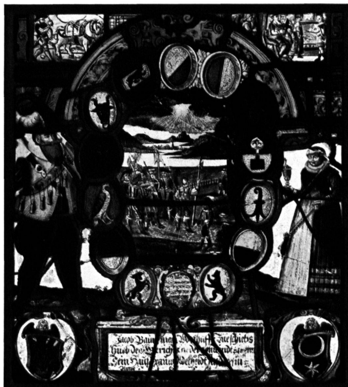
14 Scheibe Baumann-Anderes, Egnach, 1658