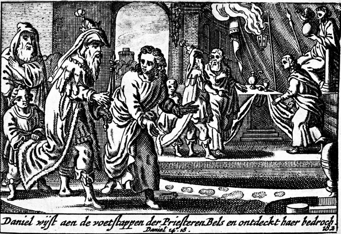
Daniel wijst aen de voetstappen der Priesteren Bels en ontdeekt haer bedroch. Daniel 14. 18. 182