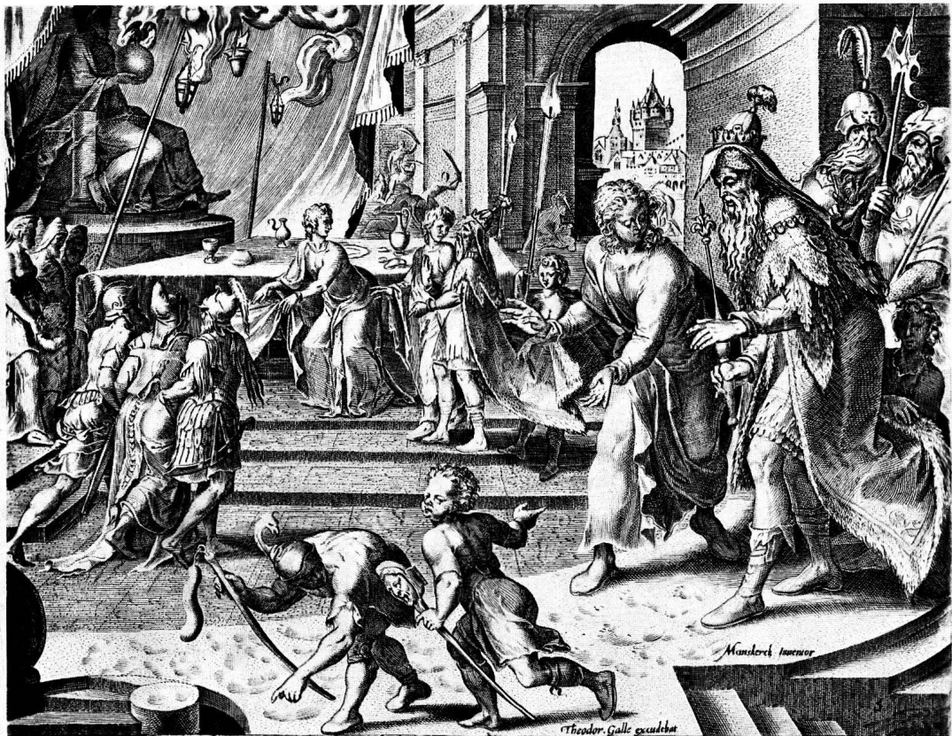
3 Daniel beneficio cribrati cineris interitum sacerdotum machinatur.

Maarten Heemskerck Inceptor Hieronymus Cock excudit