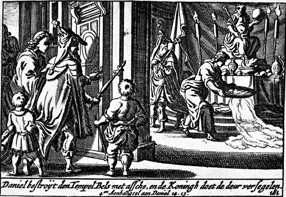
Daniel bestroijt den Tempel Bels met asche, en de Koningh doet de deur versegelen. 4 en Aenhàngsel aen Daniel 14. 13. 181