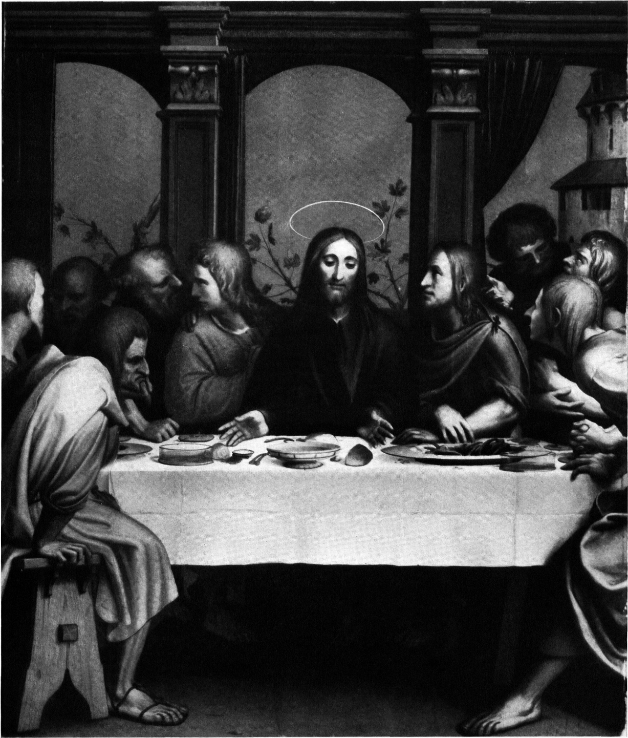
Hans Holbein der Jüngere, Das Abendmahl, um 1524. H. 115,5 cm, Br. 97,5 cm. Basel, Öffentliche Kunstsammlung