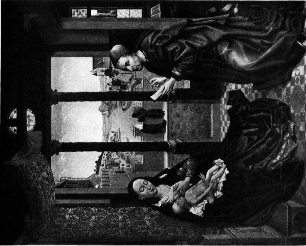
4 Hans Holbein der Jüngere, Maria mit Kind und die Heiligen Nikolaus und Ursus, 1522. H. 140 cm, Br. 100 cm. Solothurn, Städtisches Museum. 5 Rogier van der Weyden (Kopie nach), Der heilige Lukas, die Madonna zeichnend. H. 138 cm, Br. 111 cm. München, Ältere Pinakothek