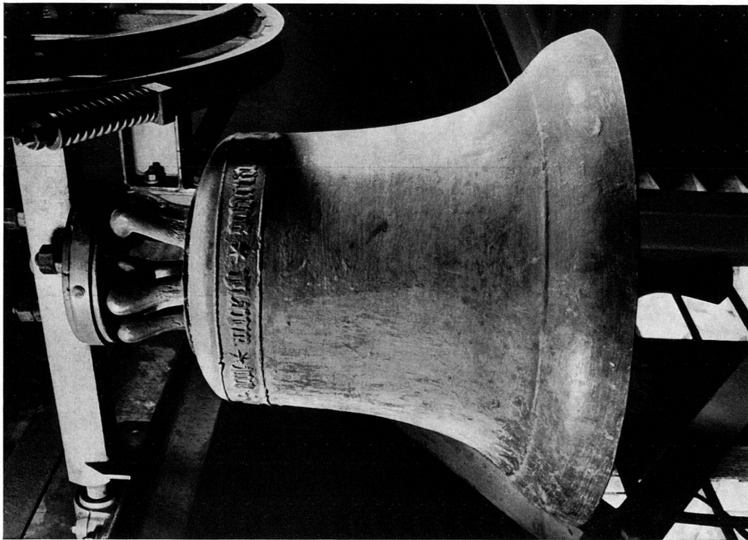
Trogen AR, Pfarrkirche – Glocke von 1465 (sog. Henkerglöckli)