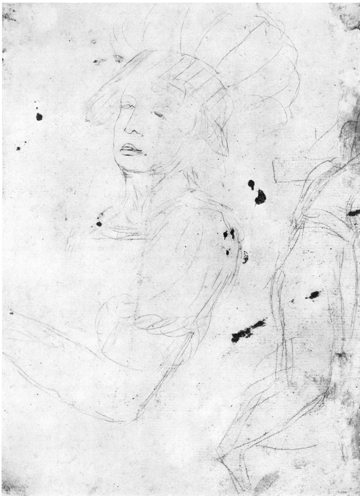
Heinrich Füssli, Femme inconnue, esquisse au crayon. Verso du dessin de la planche 36 (248 × 177 mm). Musée national suisse