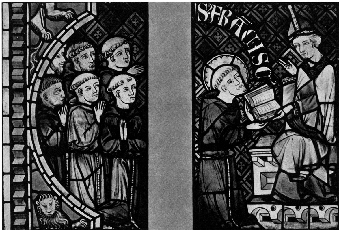
8, 9 Ausschnitte aus der Bestätigung der Franziskanerregel durch Papst Innozenz III. Oben : Assisi, S. Francesco, Oberkirche. Unten : Königsfelden, Franziskusfenster