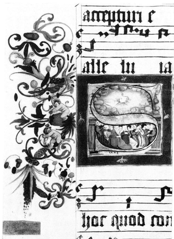
6 Strassburg, Nationalbibliothek, MS 4982, fol. i (4) – 1523. – 7 Strassburg, Nationalbibliothek, MS 4982, fol. xv v o (18 v o ) – 1523. – 8 Strassburg, Nationalbibliothek, MS 4982, fol. cxj (114) – 1525. – 9 Strassburg, Nationalbibliothek, MS 4982, fol. cxij v o (116 v o ) – 1523

FRANZ GERSTER, EIN BASLER DILETTANT DER HOLBEINZEIT