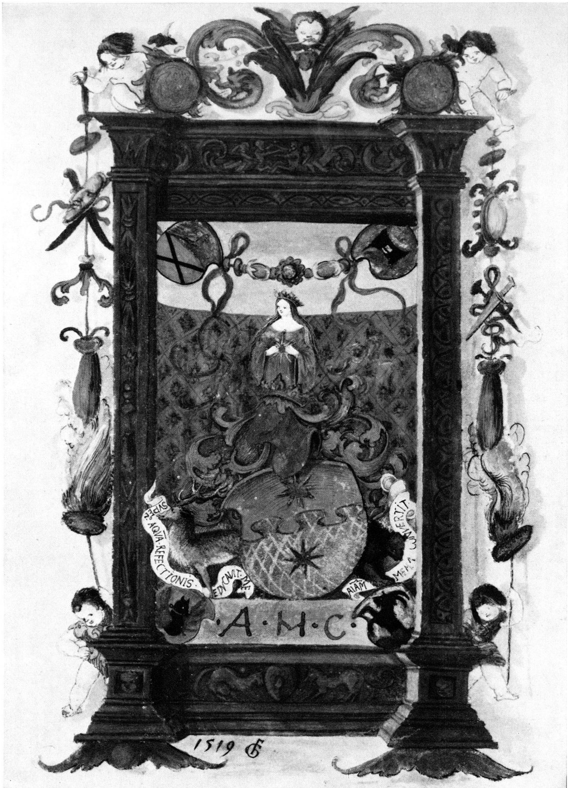
1 Basel, Universitätsbibliothek, AN II 3, fol. 146 v o (1519)

FRANZ GERSTER, EIN BASLER DILETTANT DER HOLBEINZEIT