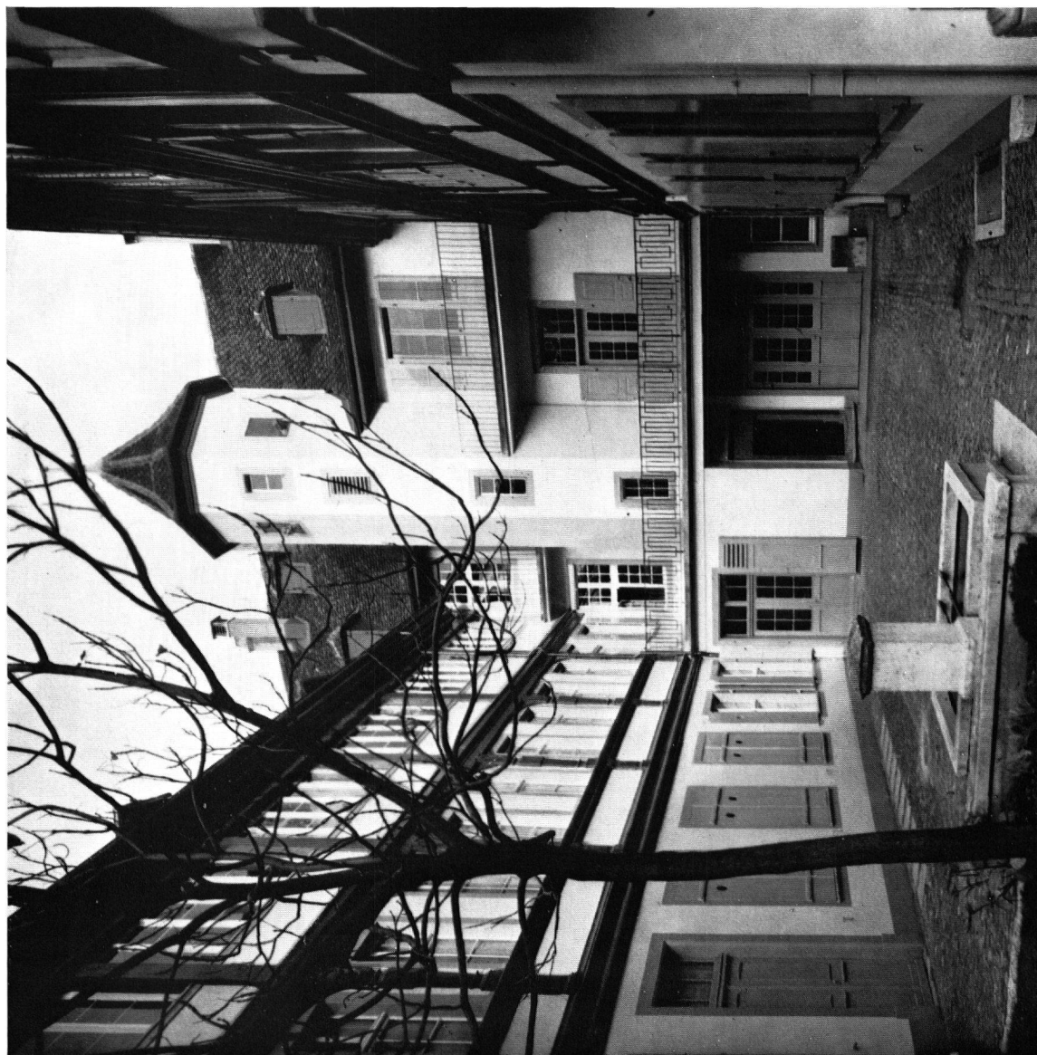
a-c Haus St.-Johanns-Vorstadt 17, Basel. - a Hofansicht. An den obersten Fenstern des Türmchens die Büsten der Abb. b und c . - b-c Diebschreckfiguren am Haus St.-Johanns-Vorstadt 17, Basel.

R. WILDHABER: DIEBSCHRECKFIGUREN UND TÜR WÄCHTERBILDER