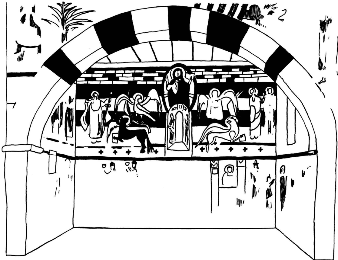
Abb. 9. – Kirche St. Lorenz bei Paspels. Choransicht (vgl. auch Tafel 12).