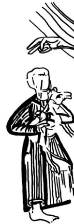
Abb. 10. – Kirche St. Lorenz bei Paspels. Romanische Wandmalereien: Abel mit dem Lamm (linkes Gewände des Ostfensters; vgl. auch Tafel 13 a).