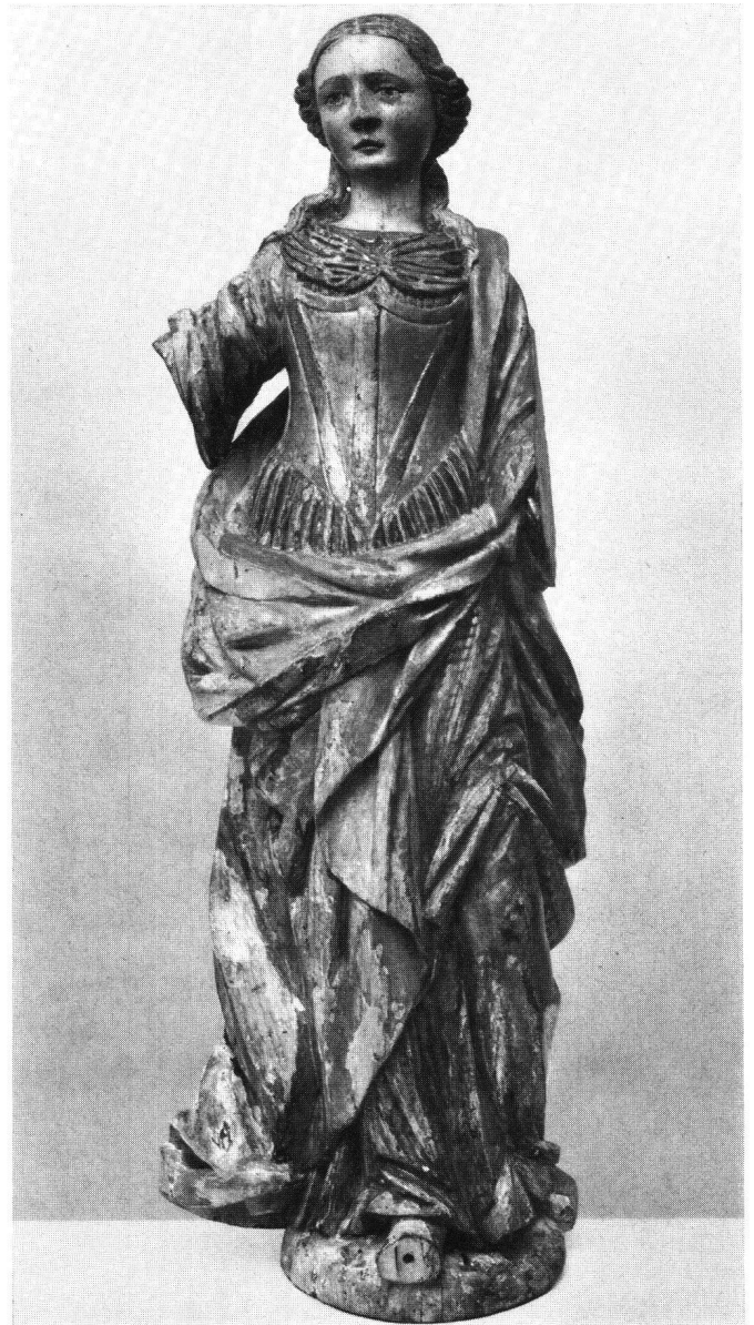
Abb. 1 Heilige. Lindenholz, mit alter Fassung. Signierte Arbeit des Jakob Hunger aus Rapperswil, 1710. Zürich, Schweizerisches Landesmuseum

terlassen einen gekünstelten Eindruck; er wirkt eine deutliche Stufe zu «hoch» gegriffen für diesen Bildhauer, hinter