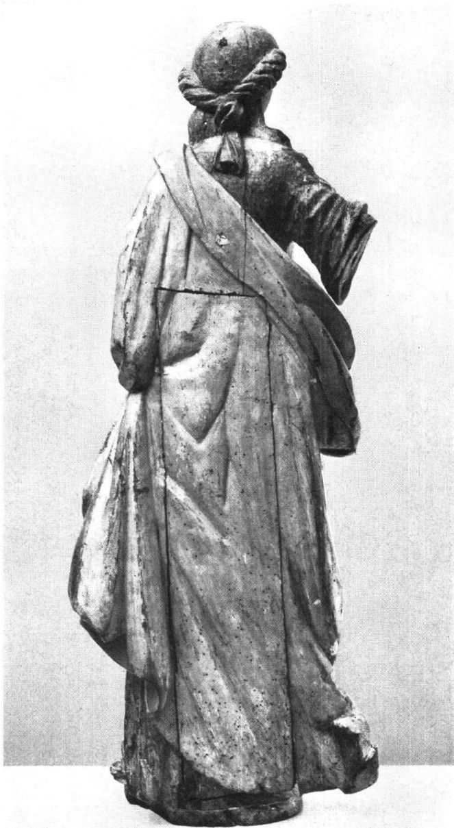
Abb. 2 Heilige (vgl. auch Abb.1). Rückenansicht mit Deckbrett, dessen Innenseite die Inschrift Abb.4 zeigt. Brett ursprünglich verleimt, später durch Nägel fixiert

dessen Arbeit man doch einen eher nüchternen Gestalter vermutet, dem es im physiognomischen Bereich nicht lag, komplexere psychische Situationen darzustellen.