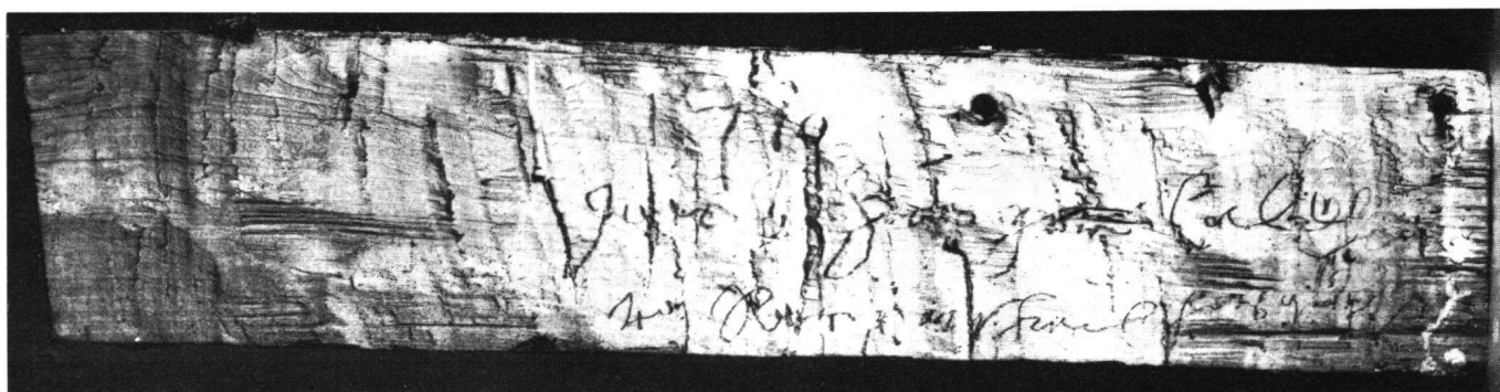
Abb. 4 Innenseite des Deckbrettes der Statue Abb.2. Inschrift (mit fetthaltigem, rotem Schreibmittel) zu lesen als «1710 Jacob Hunger Bildhauer von Rapperschwil hats gmacht»

Mit diesem «Ersatzgold» hat der Faßmaler sowohl den Leibrock der Figur (sichtbar am linken Unterschenkel) als auch das Überkleid belegt; für das korsettartige Mieder und die damit verbundenen weiten Ärmel verwendete er dagegen echtes Blattgold, welches gegenüber seinem etwas blasserem Ersatz eine intensivere Wirkung hervorrief. Echtes Gold wurde auch an die Außenseite des Mantels angeschossen, wobei im Bereich der Faltenüberschläge das satte Gold mit dem intensiven Orangerot der Innenseite (des Mantelfutters also) in ein abwechslungsreiches Spiel von Farb- und Glanzeffekten trat.