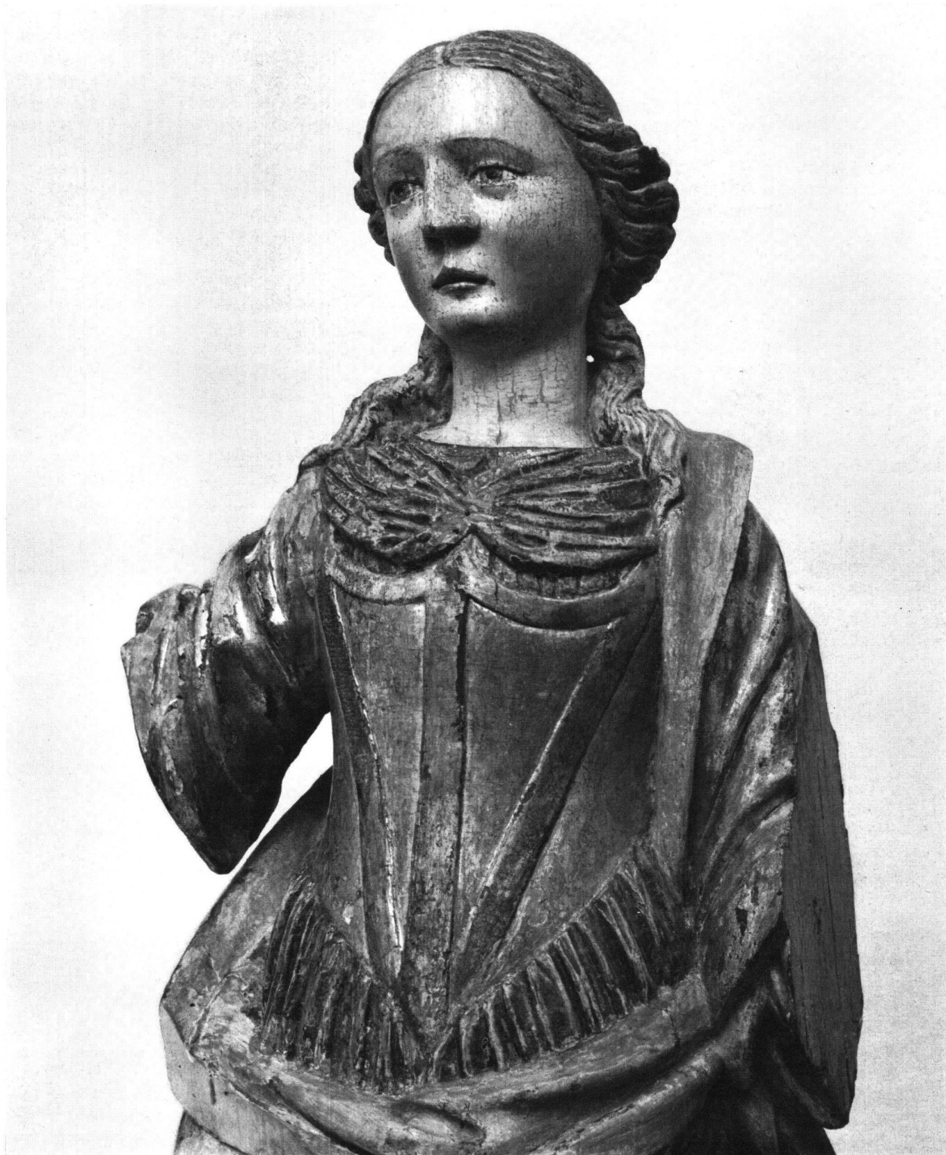
Abb. 5 Statue einer unbekanntenen Heiligen (vgl. auch Abb. 1, 2), Ausschnitt. Mieder vergoldet mit mattfarbenem Brokatdekor, Brusttuch mit Blattsinn belegt und mit Safranlack «vergoldet» sowie mit feinem, blauem Streifenmuster versehen; Leibrock und Überkleid mit derselben Ersatzvergoldung, Mantelfutter orangerot