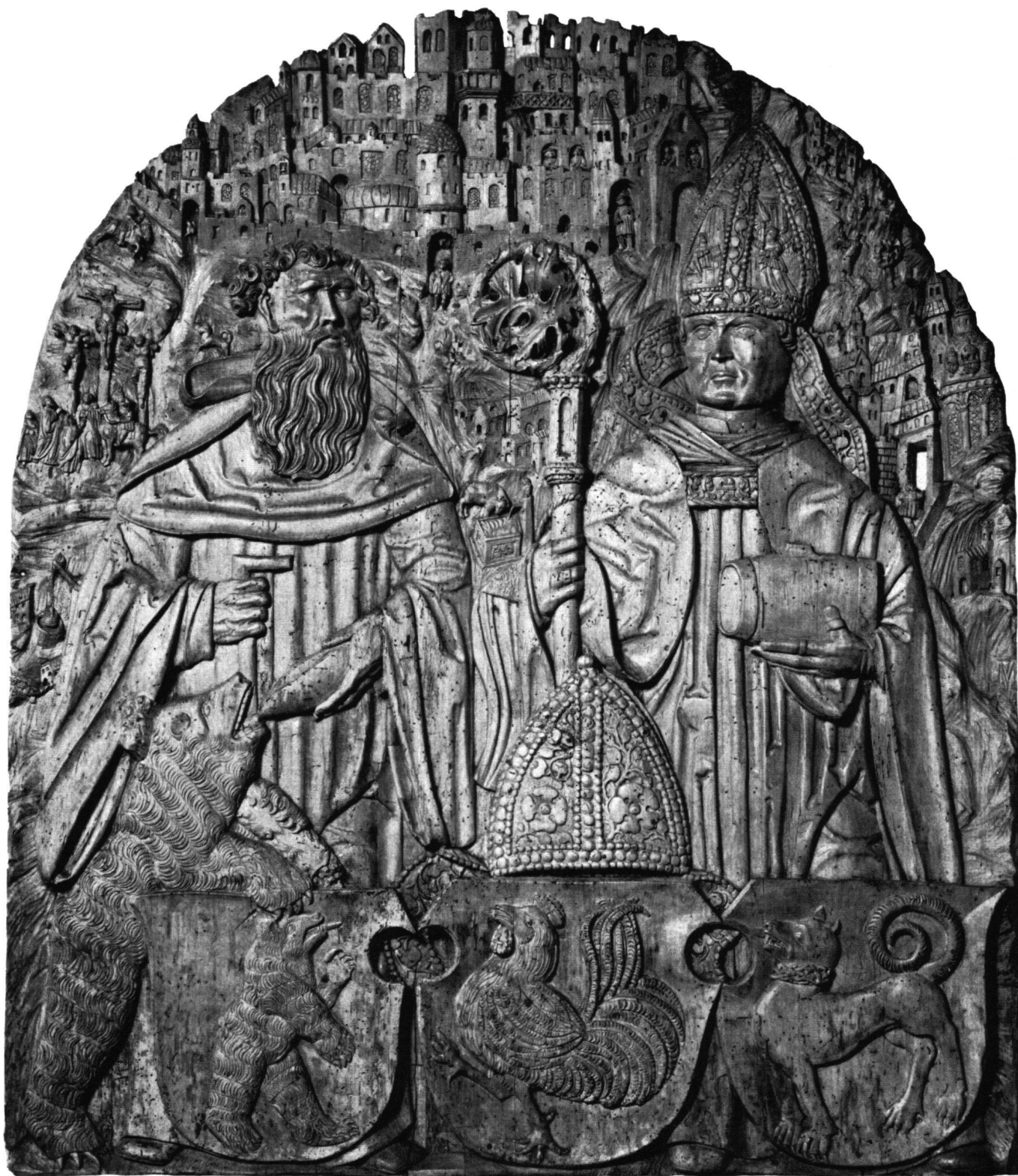
Fig. 1 Relief avec saint Gall et saint Otmar et les armoiries de l'abbé de Saint-Gall Diethelm Blarer von Wartensee. Daté de 1535. Musée national suisse, Zurich