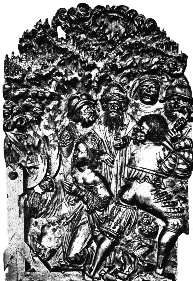
Fig. 10 Relief représentant le martyre de sainte Catherine. Vers 1530. Musée cantonal de Valère, Sion