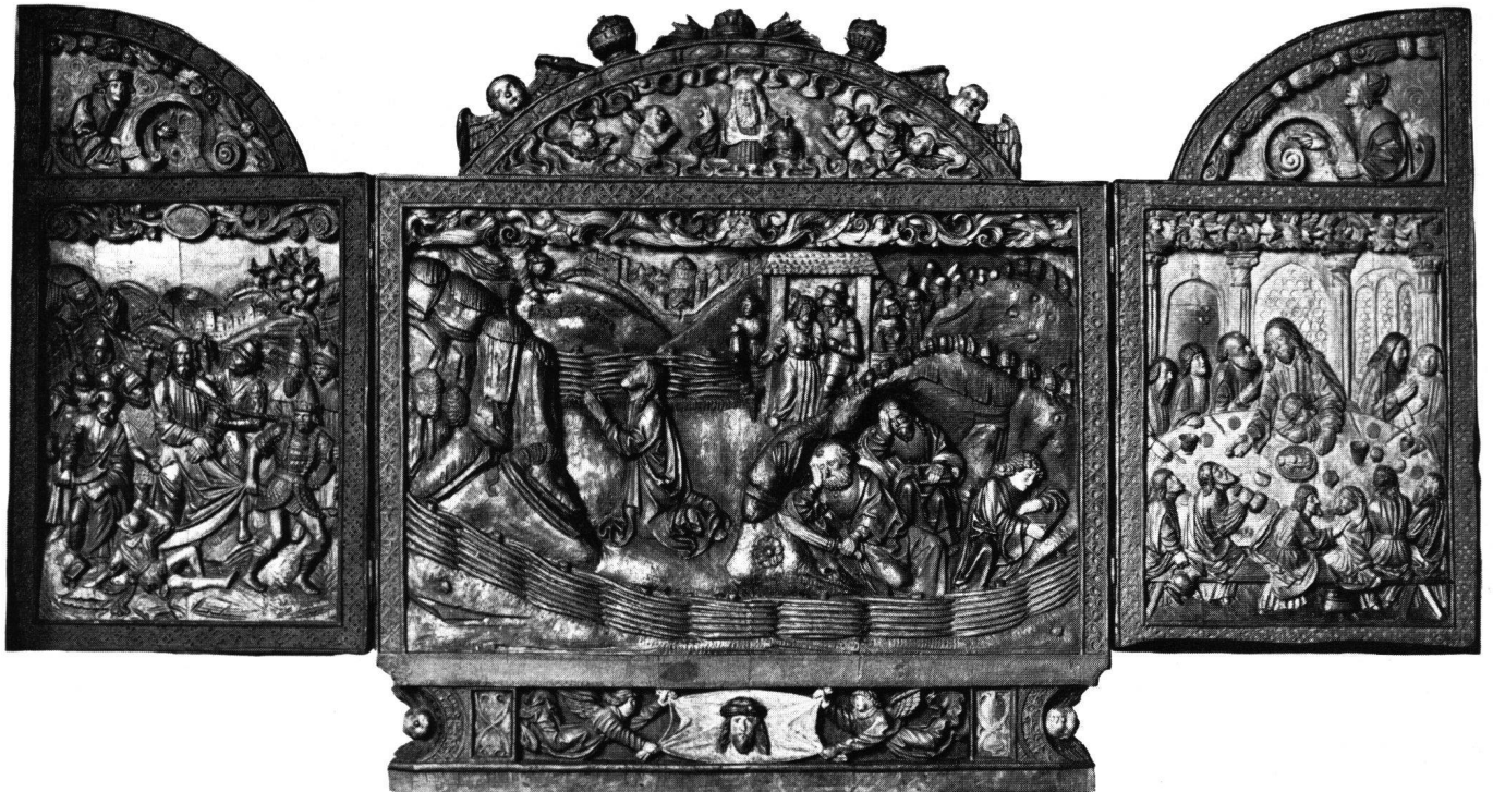
Fig. 11 Retable aux armes de la famille Imfeld. Vers 1530–1540. Musée national suisse, Zurich

Nous avons déjà signalé, au cours de cette étude, d'où provenaient ces composantes. Certains éléments, comme les personnages de la Crucifixion ou les petites figures, gravitent dans l'orbite du « style aux plis parallèles », tel qu'il fut développé en Souabe et en Bavière entre 1515 et 1530 environ. Importé par le peintre Jörg Kändel de Biberach qui fournit les retables de Vigers ou de Seewis, dans les Grisons 29 , appliqué par Hans Küng de Zurich dans ses plafonds de la maison Klausser à Lucerne et de la corporation des forgerons à Zurich 30 , ce style fleurit, surtout vers 1530, tout autour du lac de Constance et dans la