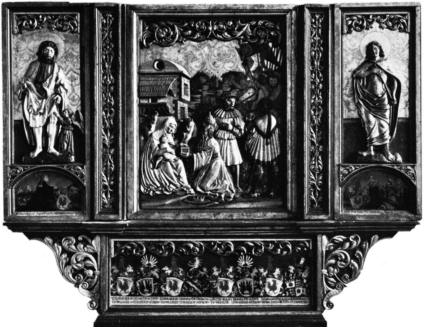
Fig. 2 Retable du château de Wartensee. Vers 1535. Musée national suisse, Zurich

Comme aucune œuvre de ces artistes ne nous a été conservée – et en attendant qu'on retrouve des fragments du retable d'Ulrich Rissi à Alt-Sankt Johann – toute tentative de rattacher l'un de ces noms avec notre relief relèverait de la fantaisie.