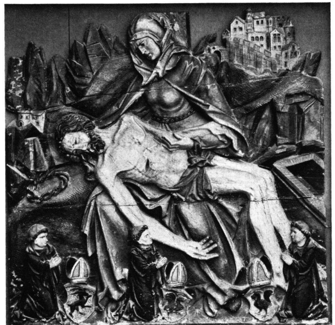
Fig. 6 Relief aux armes des abbés de Saint-Gall Franz von Gaisberg et Diethelm Blarer von Wartensee et de l'abbé d'Einsiedeln Ludwig Blarer. Vers 1530. Eglise collégiale de Bischofszell

On ne saurait comparer cette recherche aux lois classiques des proportions d'un Alberti ou d'un Vitruve. Pas plus qu'on ne trouverait dans notre relief un souci de