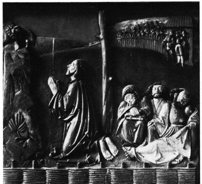
Fig. 8 Relief représentant le Christ au jardin des oliviers. Détail d'un des volets du retable de Boswil. Daté de 1542. Musée national suisse, Zurich