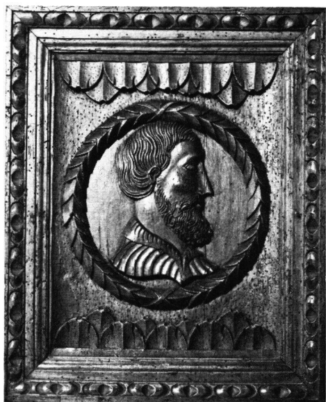
Fig. 9 Médaillon d'une armoire aux armes Schenk von Kastel et Blarer von Wartensee. Vers 1535. Musée national suisse, Zurich

l'art d'un Peter Flötner 24 . Les quatre médaillons en relief, et surtout celui représentant la tête d'un homme barbu, en bas, à gauche (fig. 9), rappellent fortement le style des visages du relief saint-gallois. La douceur du modelé, la