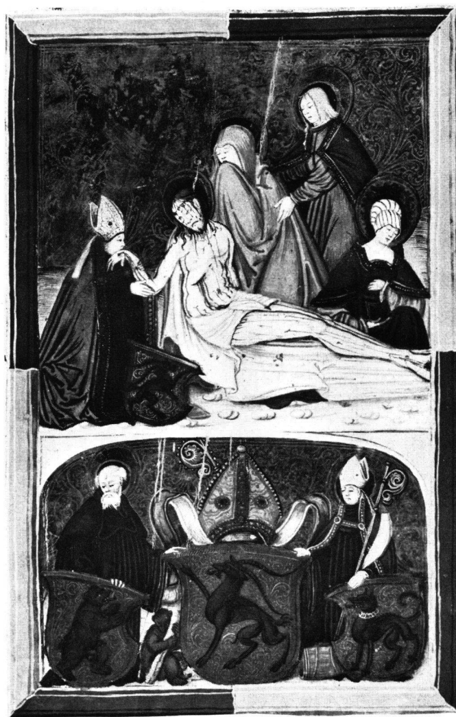
Fig. 5 Miniature du Directorium Perpetuum aux armes de l'abbé de Saint-Gall Franz von Gaisberg. Vers 1520. Stiftsbibliothek, St. Gallen, Cod. 533

Les thèmes que l'on rencontre sur le relief de 1535, d'origine locale pour les uns, plus générale pour les autres, sont juxtaposés selon un schéma compositionnel très ancien. Deux saints, en sacra conversazione devant un paysage, ayant à leurs pieds les armoiries du donateur, c'est le sujet d'une grande quantité de peintures, de dessins, de gravures ou de vitraux, non seulement du XV e siècle allemand, mais également du Quattrocento en général. Par contre, il faut s'empresse de constater que nous n'avons pas trouvé d'œuvres graphiques ou plastiques