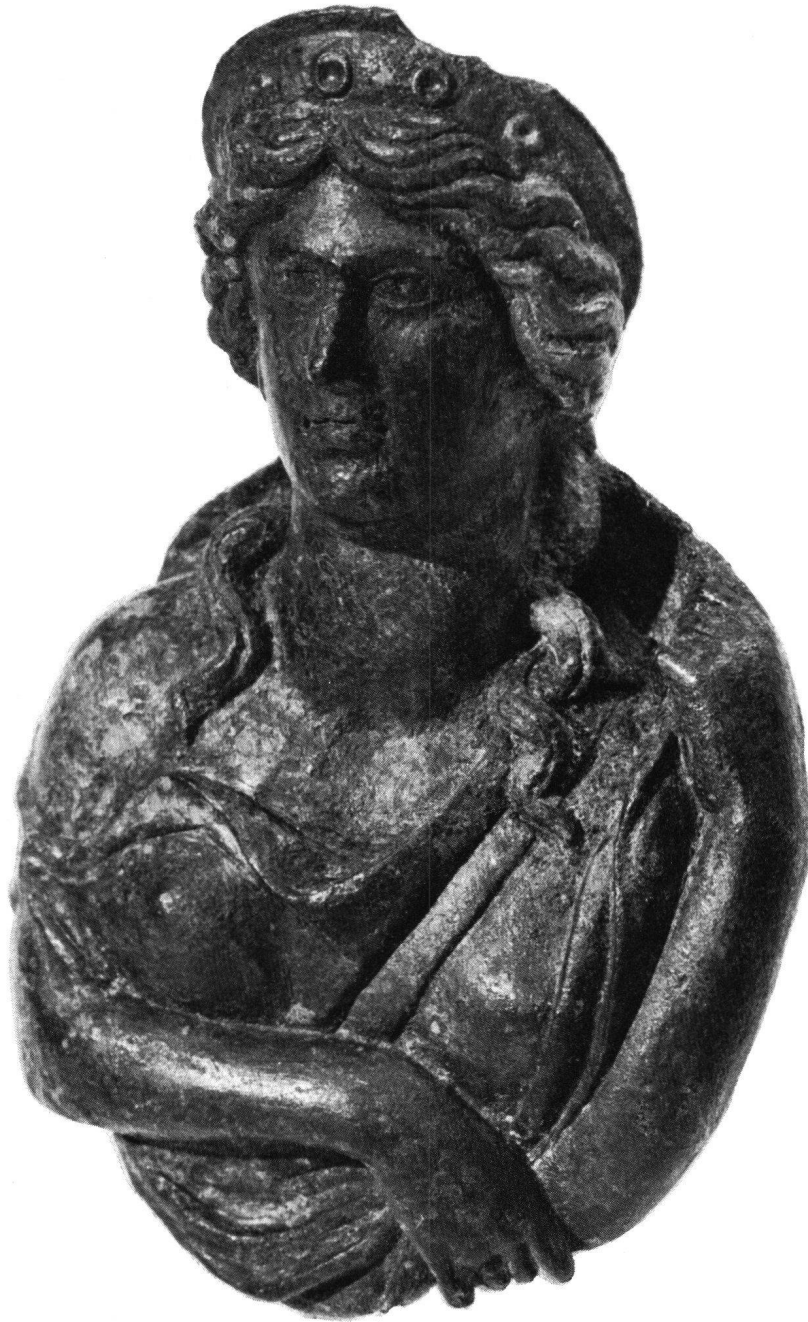
Abb. 3 Brustbild der Göttin Juno. Römisch, Bronze, Höhe 13 cm, fast vollplastisch gegossen. Dieses Relief, das um 1900 im Gebiet des römischen Vicus Aquae Helveticae (=Baden) gefunden wurde, war sehr wahrscheinlich inmitten einer Schale befestigt, die als Rahmen diente