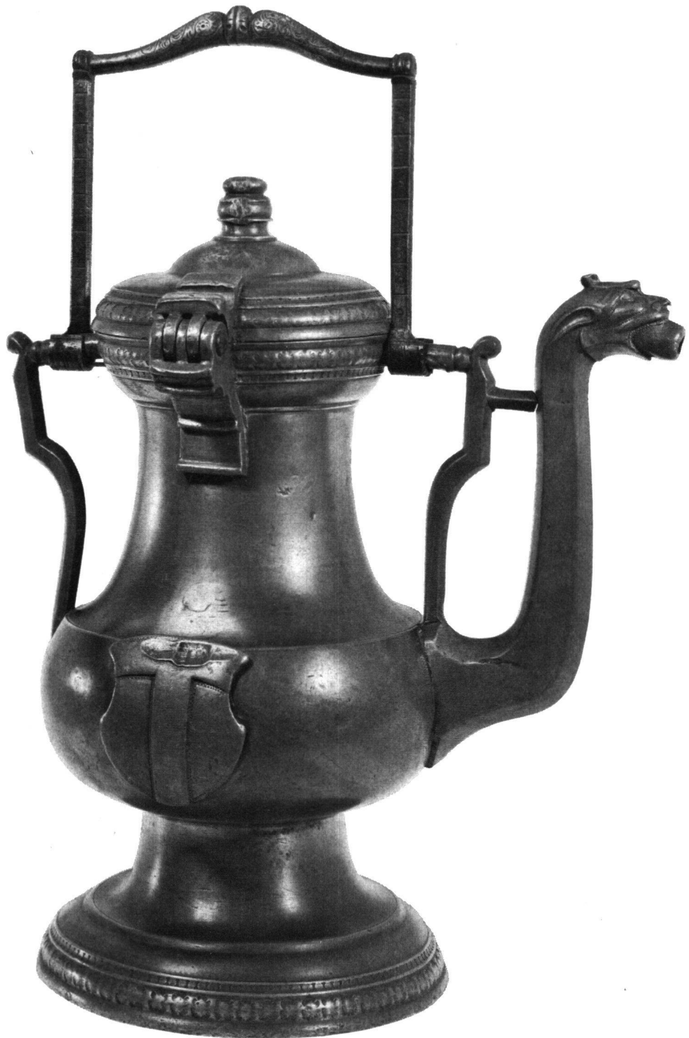
Abb. 1 Ratskanne aus Baden. Zinn, Höhe 41 cm. Um 1600 schenkte der Badener Rats- und Bannerherr Kaspar Falk der Stadt Baden diese und eine zweite, genau gleich gearbeitete Bügelkanne, welche sich im Schweizerischen Landesmuseum befindet