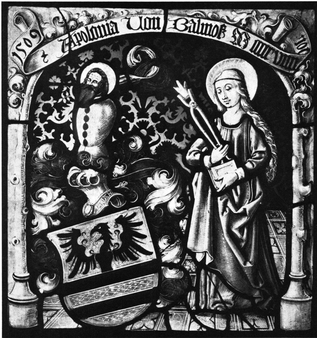
Abb. 4 Wappenscheibe der Apollonia von Balmoos, Gattin des Ritters Wernher von Meggen, damals Landvogt in Baden, gestiftet 1509 für die St.-Anna-Kapelle in Baden. Höhe 45 cm. Dargestellt ist neben dem Wappen der Apollonia von Balmoos die heilige Apollonia, die um 250 in Alexandria als Märtyrin starb. Beim Künstler muß es sich um einen bedeutenden Zürcher oder Luzerner Glasmaler gehandelt haben

Das Landvogteischloß an der Limmat war von 1415–1798 Sitz des eidgenössischen Landvogtes über die Grafschaft Baden. Das Gebäude stammt zur Hauptsache aus den Jahren 1487–1489; es steht an der Stelle einer früheren Anlage, die erstmals 1265 urkundlich erwähnt wird, wohl aber schon früher als Brückenkopf bestanden hatte. Anbauten wurden 1580 und 1733 vorgenommen. Nachdem 1798 die Landvogtei aufgehoben worden war, erfuhr das Gebäude verschiedene Zweckbestimmungen; erst 1913 überführte man die städtische Sammlung aus dem Kursaal in das entsprechend renovierte Landvogteischloß. Seither wird das Museum von einer Museumskommission betreut. Kern der Ausstellung bildet die umfangreiche und bedeutende Sammlung römischer Altertümer aus dem römischen Badeort Aquae Helveticae = Baden, deren Bestand hauptsächlich um die Jahrhundertwende zusammengetragen wurde. Diesen Grundstock erweiterte man in den folgenden Jahrzehnten durch eine Waffensammlung, durch kirchliche Altertümer, historisches Mobiliar und Gebrauchsobjekte sowie durch eine prähistorische Sammlung. Auch Teile der großen graphischen Sammlung, die hauptsächlich Badener Stadtansichten und Werke von Badener Malern des 19. Jahrhunderts enthält, können heute gezeigt werden. Besonders reizvoll sind die beiden Modelle der Stadt und der Bäder, die den Zustand um 1670 wiedergeben.