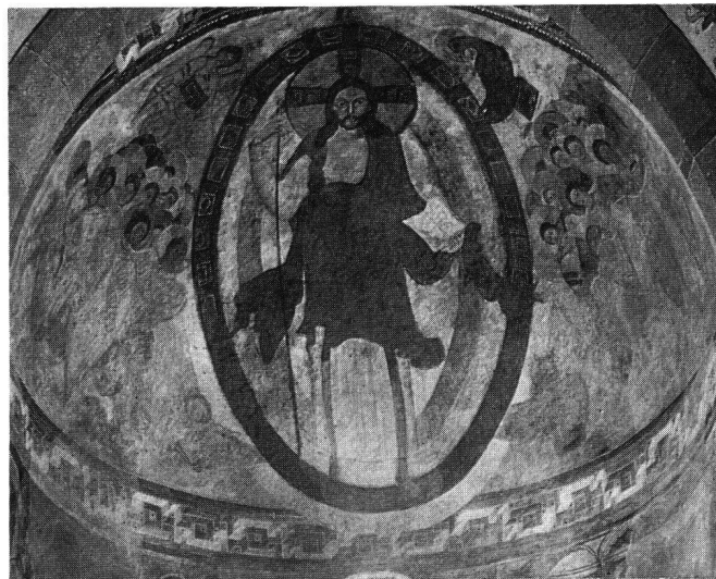
Fig. 3 Müstair, église Saint-Jean: abside principale (Côté est)

Si le projet de décor de Carmina Sangallensia VII correspondait effectivement au schéma bien connu que je restitue ici en traduisant tronus par abside et non par trône , je me demande s'il ne conviendrait pas de restituer au-