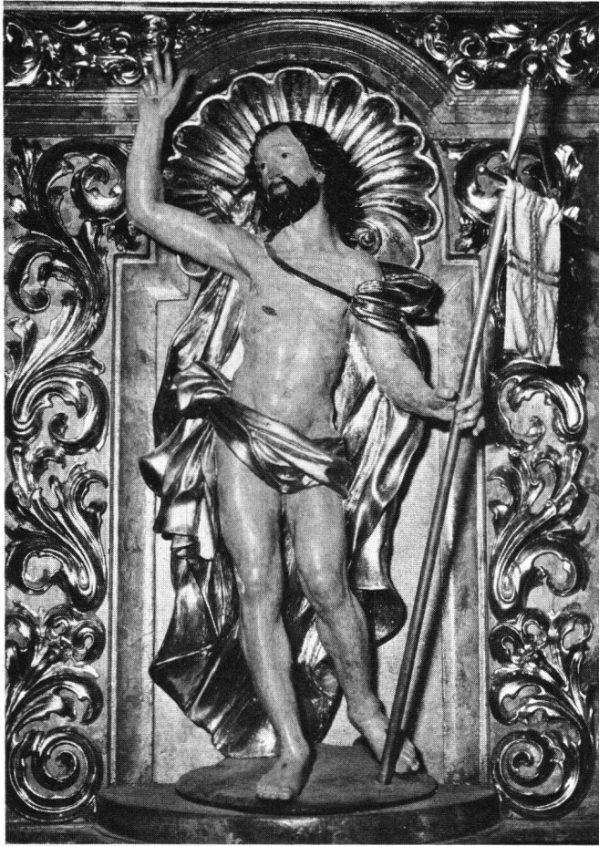
Abb.89 Christus der Auferstandene an der Kanzelbrüstung

die zweite Fassung von Freitag ist. Der erste Samson war dem fürstlichen Stift zu klein, so daß er einen größeren schnitzen mußte 24 . Was mit der ersten, zu kleinen Fassung des Kanzelträgers geschah und wie sie aussah, wissen wir nicht. Jedenfalls haben wir hier ein Beispiel für die schöpferische Mitwirkung des Auftraggebers.