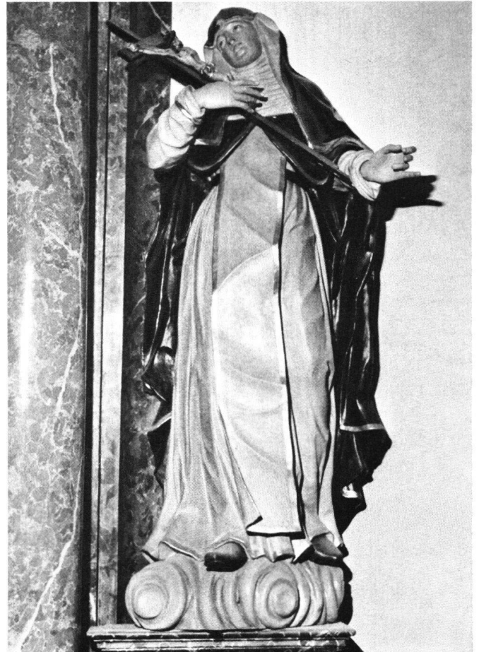
Abb.91 Die heilige Katharina von Siena, vom Nebenaltar im nördlichen Seitenschiff

kus, visionär mit ausgebreiteten Armen, empfängt die Wundmale; Katharina betrachtet verzückt das Kreuz; Dominikus mit dem Hund zu seinen Füßen trägt in sich versunken den Rosenkranz, den er von der Muttergottes erhalten hat.