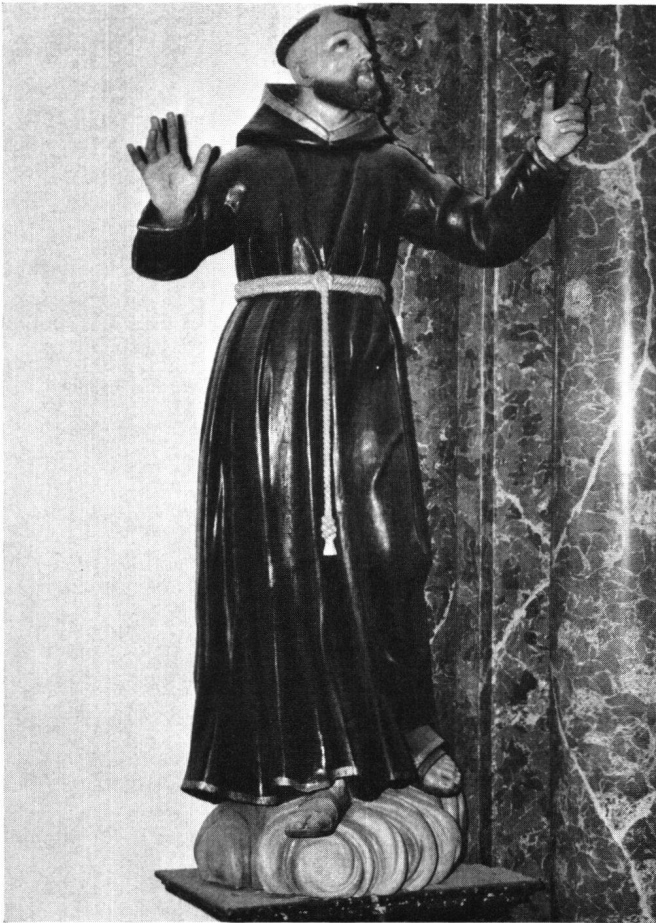
Abb.90 Der heilige Franz von Assisi, vom Nebenaltar im südlichen Seitenschiff