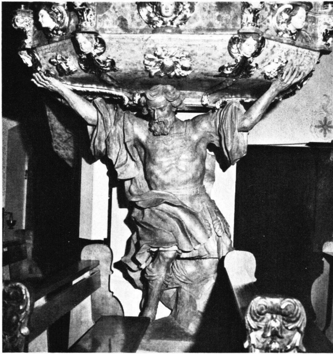
Abb.87 Samson als Kanzelträger, von Johann Isaak Freitag

In der Gestaltung der Gewänder unterscheidet Freitag zwischen Rock einerseits und Umhang oder Pluviale andererseits. Das körpernahe Kleid fällt in parallelen Grutfalten entweder bis zum Boden oder bis zur Wade. Der Umhang und das Pluviale hingegen bringen Bewegung in die Figur, indem sie über- und umgeschlagen bewegte, weiche Muldenfalten bilden, die sich im Saum aufwerfen.