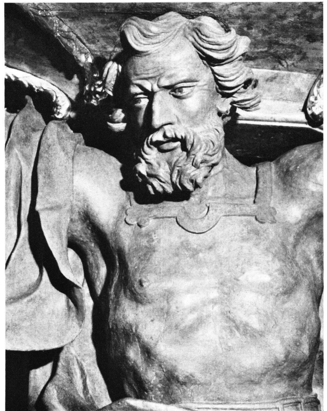
Abb.88 Kopf des Kanzelträgers Samson (Detail aus Abb.87)

Der Kanzelträger Samson gehört zu den qualitativsten Plastiken Freitags. Durch seine weit ausholende Geste vermittelt er den Eindruck von ungebändigter Kraft und macht das Tragen der Kanzel glaubhaft. Allerdings ergibt sich aus den Akten, daß diese Plastik des Kanzelträgers