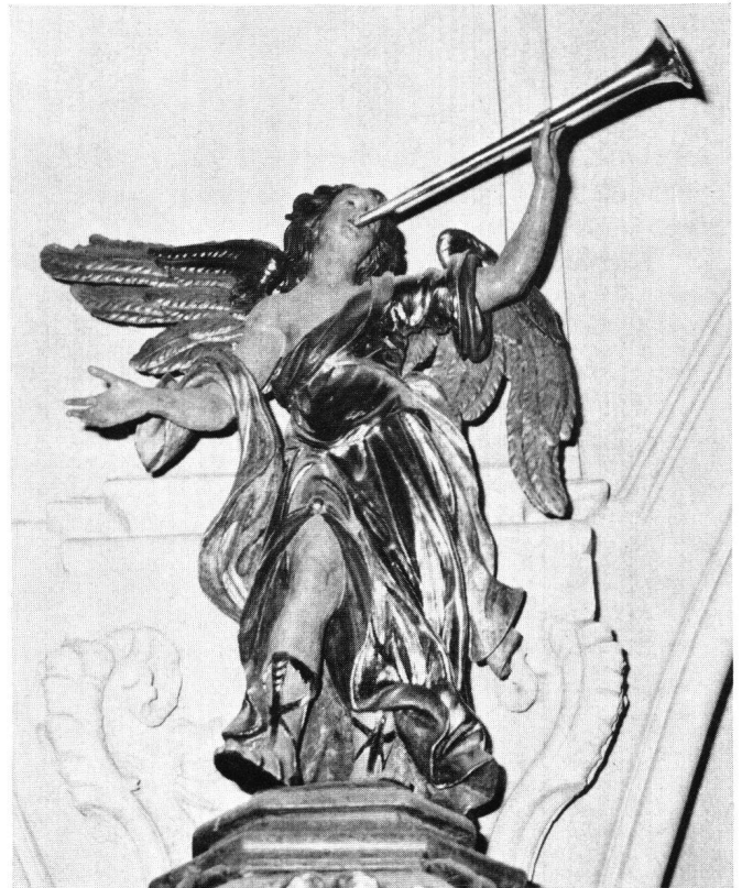
Abb.89a Posaunenengel auf dem Schalldeckel der Kanzel

Diese Plastiken stellen im Figurenrepertoire Freitags einen zusätzlichen Typus dar: den des visionären und emphatisch bewegten Heiligen in einfacher Ordenstracht. Antonius trägt das Christuskind in den Armen; Franzis-