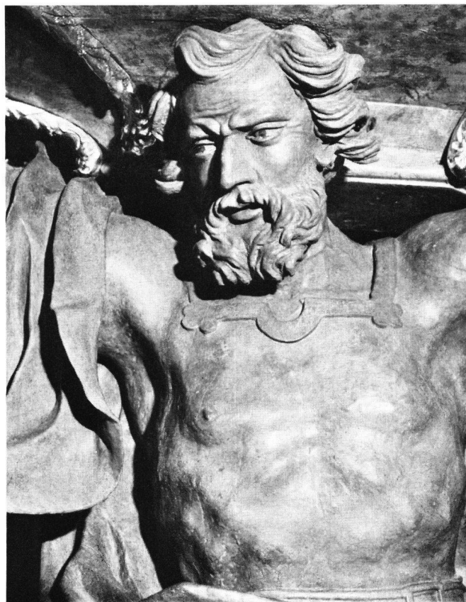
Abb.88 Kopf des Kanzelträgers Samson (Detail aus Abb.87)

Der Kanzelträger Samson gehört zu den qualitativsten Plastiken Freitags. Durch seine weit ausholende Geste vermittelt er den Eindruck von ungebändigter Kraft und macht das Tragen der Kanzel glaubhaft. Allerdings ergibt sich aus den Akten, daß diese Plastik des Kanzelträgers