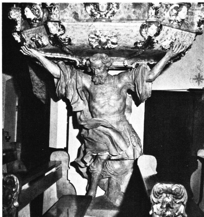
Abb.87 Samson als Kanzelträger, von Johann Isaak Freitag

In der Gestaltung der Gewänder unterscheidet Freitag zwischen Rock einerseits und Umhang oder Pluviale andererseits. Das körpernahe Kleid fällt in parallelen Grutfalten entweder bis zum Boden oder bis zur Wade. Der Umhang und das Pluviale hingegen bringen Bewegung in die Figur, indem sie über- und umgeschlagen bewegte, weiche Muldenfalten bilden, die sich im Saum aufwerfen.