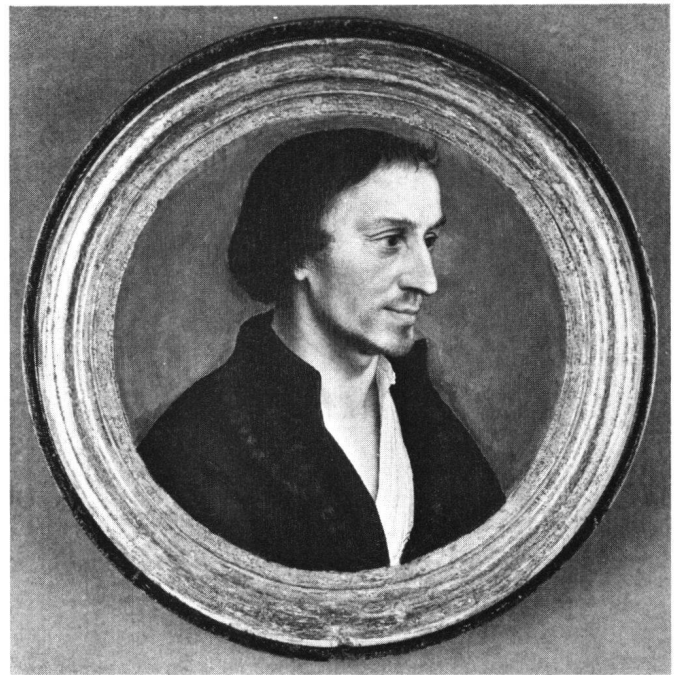
Abb. 5 Hans Holbein d.J.: Bildnis des Ph. Melanchthon, Tempera auf Eichenholz (Durchmesser 9 cm), 1535/1536 (Niedersächsische Landesgalerie Hannover)