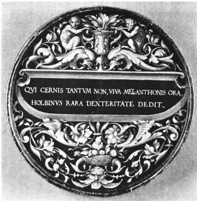
Abb. 4 Hans Holbein d.J.: Innenseite des Deckels zum Medaillon mit dem Bildnis des Ph. Melanchthon (Durchmesser 9 cm), 1535/1536 (Niedersächsische Landesgalerie Hannover)