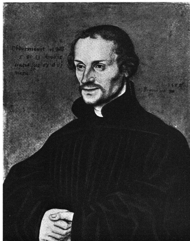
Abb. 7 Lucas Cranach d.Ä.: Bildnis des Ph. Melanchthon, 1532 (Gemäldegalerie Dresden)

All dies verliert sich freilich in die Gefilde der Phantasie. Sicher ist jedenfalls, daß sich die Kapsel später in königlichem Besitz befand und durch die Personalunion des Hauses Hannover in die deutsche Residenz gelangte: «Aus kurfürstlich-hann. Besitz» heißt es im Katalog der Niedersächsischen Landesgalerie von 1954 24 . 1925 wurde sie von dieser erworben.