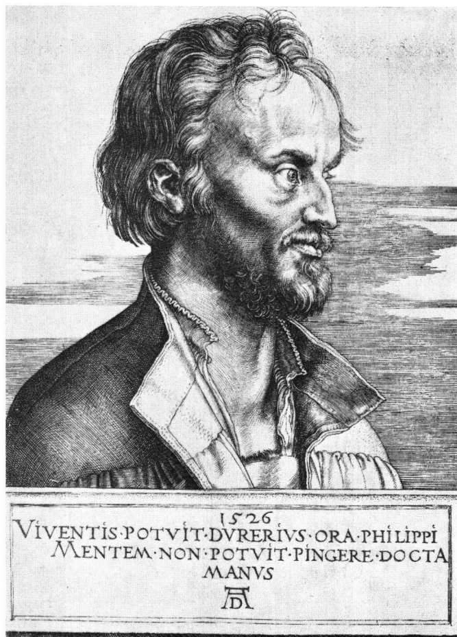
Abb. 6 Albrecht Dürer: Kupferstich, 1526. Bildnis des Ph. Melanchthon (B. 105)

Thomas Cranmer mit der Bibelübersetzung Coverdales von 1535 in Betracht zu kommen.