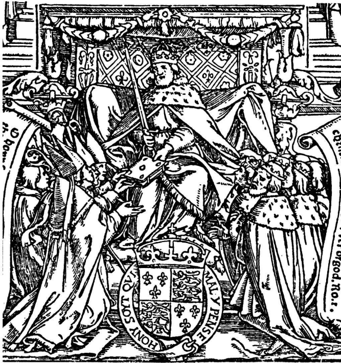
Abb. 3 Hans Holbein d. J.: Holzschnitt (Totalmaße 27,4 × 16,7 cm), 1535. Titeleinfassung für die Folio-Ausgabe der Coverdale-Bibel (Ausschnitt unten Mitte)

das Gesetz vorliest und damit erneuert, rechts Petrus, wie er, gleich den ihm folgenden Jüngern mit einem Pfingstflämmchen auf dem Scheitel, predigend vor eine lauschende Versammlung tritt. Mit den bisher genannten Oktavtiteln teilt auch diese große Komposition den feinen, gleichmäßigen Grafton.